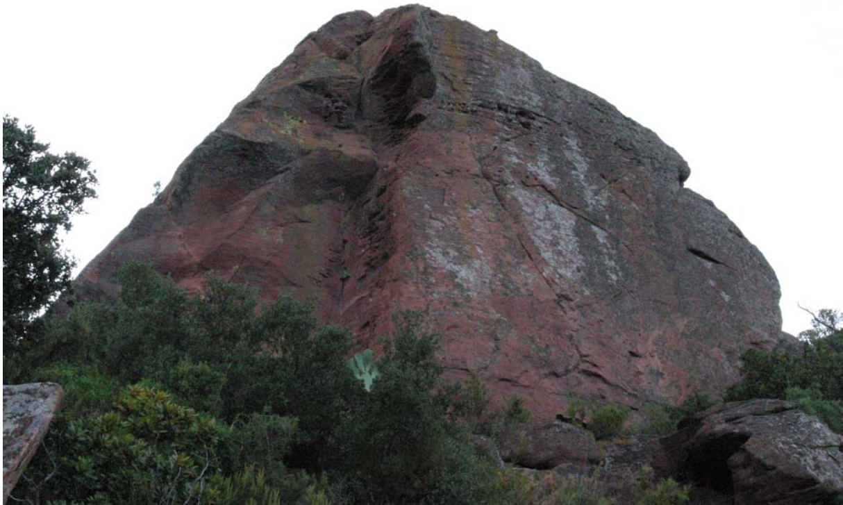
Pedra vestida . Montroig, 2004

atenció als signes que desprèn la matèria. Tothom detecta un flux continu en l'activitat del pensament, una força intensa que irradia el món que ens envolta, una pregunta de la qual sempre som presoners. La dificultat sorgeix en voler alliberar-se de les imatges condicionades, de les veritats i solucions apreses. Allò que realment és important en aquesta qüestió són aquelles realitats que destil·la el pensament de manera espontània, que deixa anar en llibertat sense censura prèvia. Podríem dir que són l'expressió del mecanisme propi del sistema, el que connecta directament amb els secrets de la matèria i gaudeix permanentment de la realitat estètica.