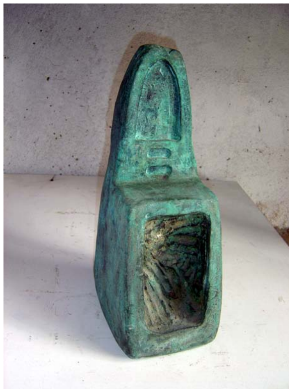
Arquitectures . Castellvell, 1986. Bronze, 32 x 23 x 20 cm.

Un canvi radical en la concepció del món s'ha donant davant nostre en els últims anys i allò que anomenem postmodernitat no és res més que el rostre de la incertesa, la cara travestida d'un món sense vores, un univers mental on totes les realitats són possibles. En aquest escenari de creació saturada, de realitats discutibles, s'ha pres consciència d'un valor intrínsec a la creació, el cultiu de la mirada pròpia i el desig de permanència en l'obra. En l'era de la informació és paradigmàtic que cap