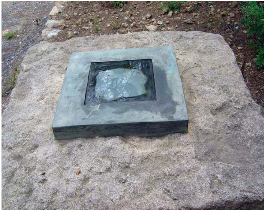
Borrar las palabras. Castellvell, 1990. Pedra, bronze, vidre i porcellana. 90 x 90 x 90 cm.

la immensitat del buit de l'univers, per a trobar definitivament el nostre destí en el gran riu de la matèria. L'anell ha estat una excusa per viure, un viatge divertit en el pas de la vida i un relat que espero entretingui a les persones encuriosides en els freds dies d'hivern i alguna nit de primavera. En l'alè misteriós que l'obra expressa diposito la meva confiança, en la realitat que flueix al seu interior descansen