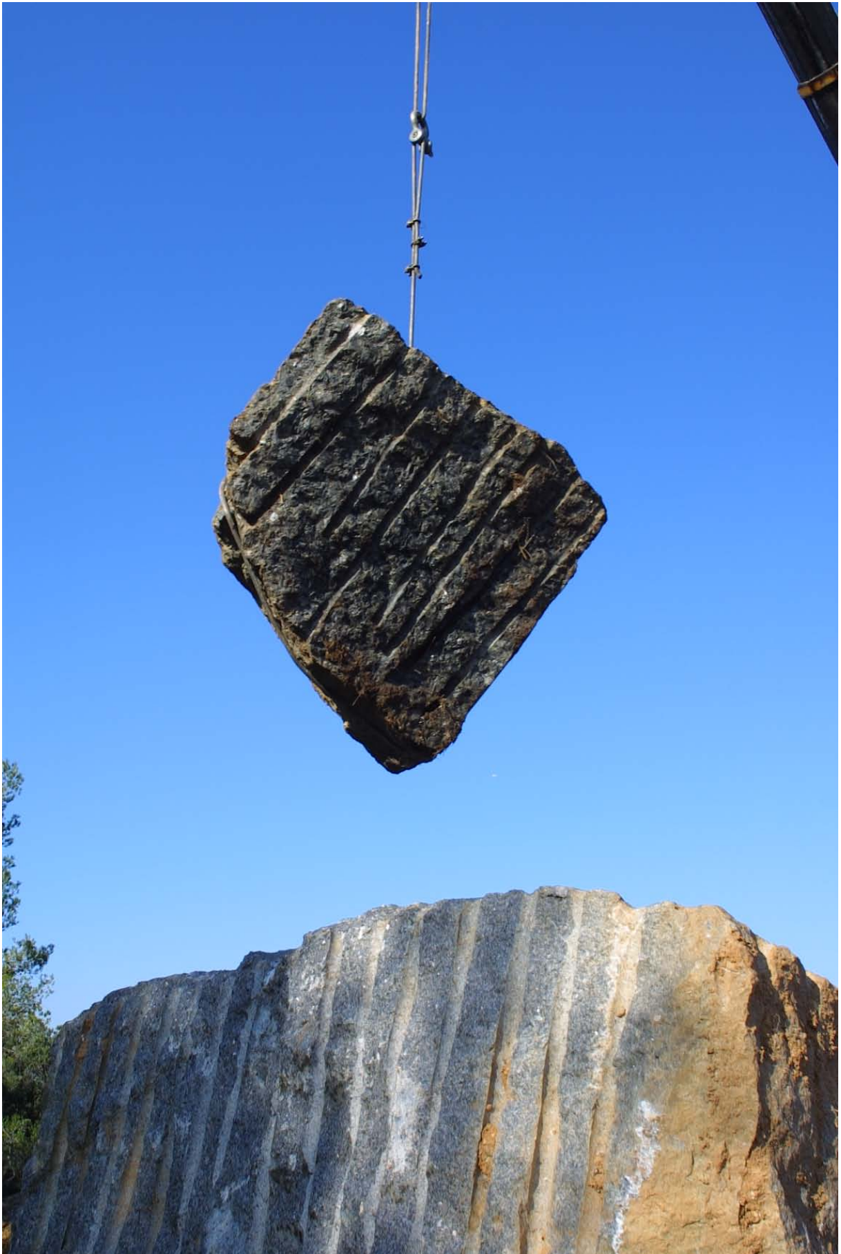
Pedra sobre fons blau. La Comella, 2001, Foto Pep Borrell Garcíapons. Acció: construcció de l'Anell de pedra.