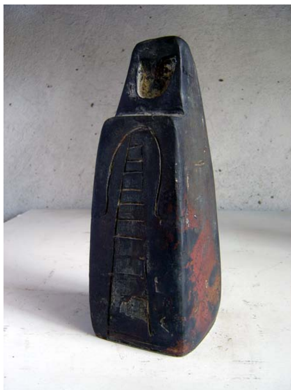
Hombre que lleva la casa dentro . Castellvell, 1993. Bronze. 32 x 12 x 12 cm.

El mecanisme del pensament ens separa com el riu les pedres, i tan sols podem compartir complicitats i bones intencions; l'experiència, però, és d'aïllament. Així naveguem en la incertesa i ens veiem obligats a renunciar, fins i tot, a la nostra realitat mental. Els problemes humans no