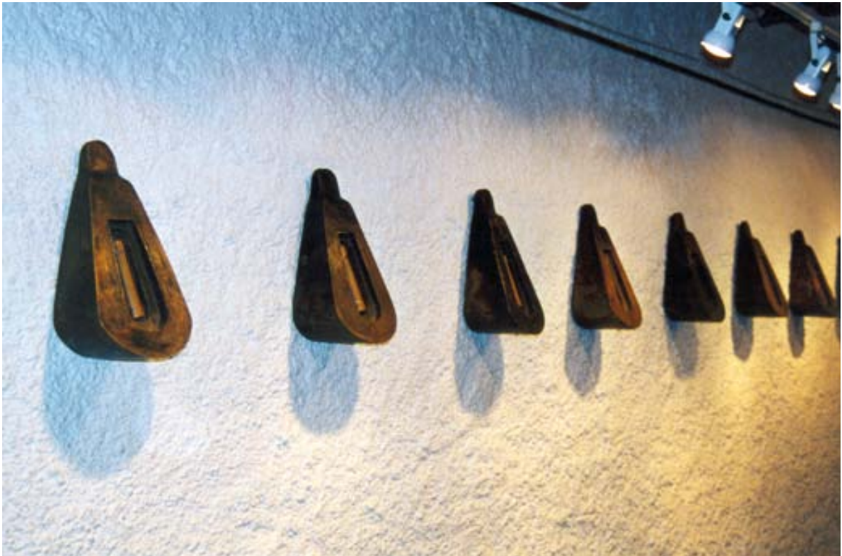
Palabra oscura . La Comella, 2001. 6 obres. Bronze, fang i altres materials. 60 x30 x 30 cm.

una perspectiva especial per a contemplar els esdeveniments de la història, per a veure com es formula el temps a l'escala de la comprensió humana. Al forat blanc per on surt l'obra del poeta hi deu haver una platea per observar en directe el precís instant de la creació. Aquest espai deu ser molt semblant al que proposa Sir James Jeans sobre la creació contínua de matèria a escala universal. Escriu sobre la dinàmica de les galàxies i afirma que l'espai, en la seva expansió, genera buit i, per tant, es produeix un dèficit de matèria i un estirament de l'espai-temps. Jean senyala que hi ha d'haver una dinàmica que el reompli i l'ocupi amb nova matèria. De fet, el contraire també és un creador d'idees, de formes, d'hipòtesis que cobreixen els buits, que omplen els espais que queden entre imatges. Potser fa com l'univers en la seva construcció, segons els models de la física, potser les idees vagabundes també vinguin a omplir els espais deficitaris del saber i les hipòtesis manifestades en l'escala de l'inconscient col·lectiu siguin una manera d'escanjar els dèficits d'il·lusions. En