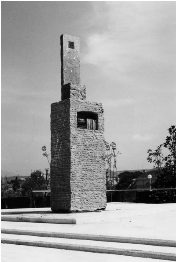
Senyal amb memòria. Igualada, 1989. Obra en commemoració del Mil·lenari de Catalunya. Conjunt de varies peces. Marbre de Markina i bronze. 510 x 100 x 100 cm.

informació sigui posseïdora de la veritat i cap veritat assumeix el seu estatut a través de la informació. L'erudició intel·lectual no és altra cosa que un suport dialèctic per arribar a destruir la teoria de l'altre, però no és cap garantia que la veritat il·lumini allò que s'està afirmant. En un món tan eclèctic com el nostre, no cal cap altre camí, si no és el que il·lumina la nostra pròpia experiència, ja que si no hi ha veritats socials remarcables, si tot és possible en el món virtual, la confirmació de la pròpia experiència s'aferra a l'existència i aquesta, a la documentació que ha produït. És a dir, la veritat i l'existència del creador van unides al fet de la producció de realitat virtual que hagi assolit, fora d'aquesta no existeix cap realitat, no existeix la història.