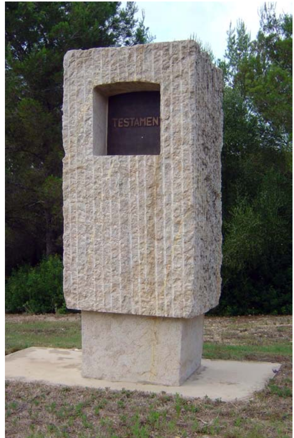
Testament , Castellvell, 1990. Pedra d'Uldecona i bronze. 310 x 110 x 110 cm. La Comella, Tarragona.

La terra és el nostre territori, és la nostra llar, per a representar-la i conèixer-la, tenim tècniques fantàstiques que donen la volta al món en un segon. Si els mitjans tecnològics no fossin tan virtuals, perversos i, alhora, innocents, si la nostra ment pogués prescindir de la fragmentació del món i veure el fons comú, el principi fonamental que l'unifica, si les imatges que veiem no tinguessin una existència tan efímera, quasi instantània, com les que vaig escriure al testament de Caïm i gravar sobre la superfície de l'aigua, segurament la nostra realitat no estaria tan plena d'incertesa. Però el món és com és i no és fet per a ser comprès, com la seva funció, queda inscrita la nostra, no sembla tenir cap destí, no podem defugir el flux imparabile de la seva creació instantània. Amb els suports de la matèria no ens queda més remei que habi-