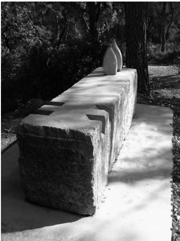
Suavizante II . Castellvell, 1989. Marbre de Markina i bronze, 210 x 60 x 80 cm. Col. La Comella.