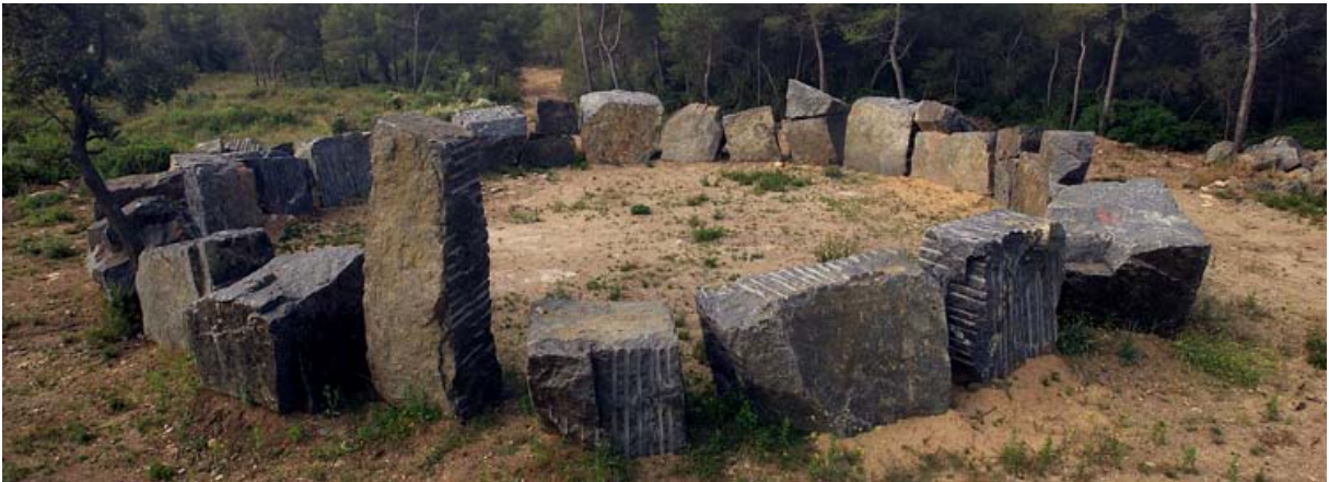
Anell de pedra . La Comella, 1976-2001. 17 m. de diàmetre x 320 d'alçada. Granit negre de la ex. U. R. S. S.

hi haurà comunicació i no es farà realitat la seva voluntat. Tanmateix, la informació hi serà oculta, eternament a l'espera de ser revelada. Igual que en la peça de ceràmica, al tub de coure, a l'urna de pedra, la informació ha quedat impresa al seu interior i allí romandrà estable, sempre atenta a les mirades de l'esperit. És molt possible que milers de codis siguin impresos al nostre voltant i ens falti el lector per fer-ne les traduccions pertinents. Si volem arribar a la comprensió d'aquest món sensible, caldrà desempallegar-se de les realitats gastades, de la memòria superficial i les estratègies personals, cal anihilar els prejudicis que condicionen el present. De fet, aquesta és la dificultat afegida de la incomunicació que defineix la nostra relació amb la natura i la realitat estètica que n'emana; ens falta la traducció lliure per entendre-la, ens falta la transparència mental, que ens permetria arribar al misteri de les coses sense cap dificultat. Si la informació i la comprensió de les ressonàncies es fa transparent, tot encaixa com en un joc de lego i la raó camina amb seguretat entre les coses concretes, ja que tot és més senzill en el moment que queden revelades, mostrades com una realitat inqüestionable.