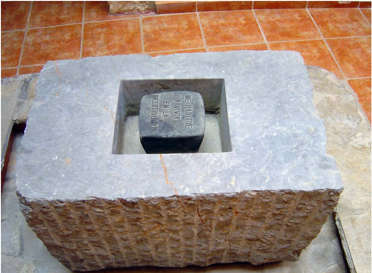
Me habitué a vivre en la incertidumbre. Castellvell, 1990. Marbre de Markina i bronze. 91 x 60 x 58 cm.

fragmentació, trenca les coses a bocins per arribar a tenir la sensació que el món es fa comprensible i a l'abast de la ment.