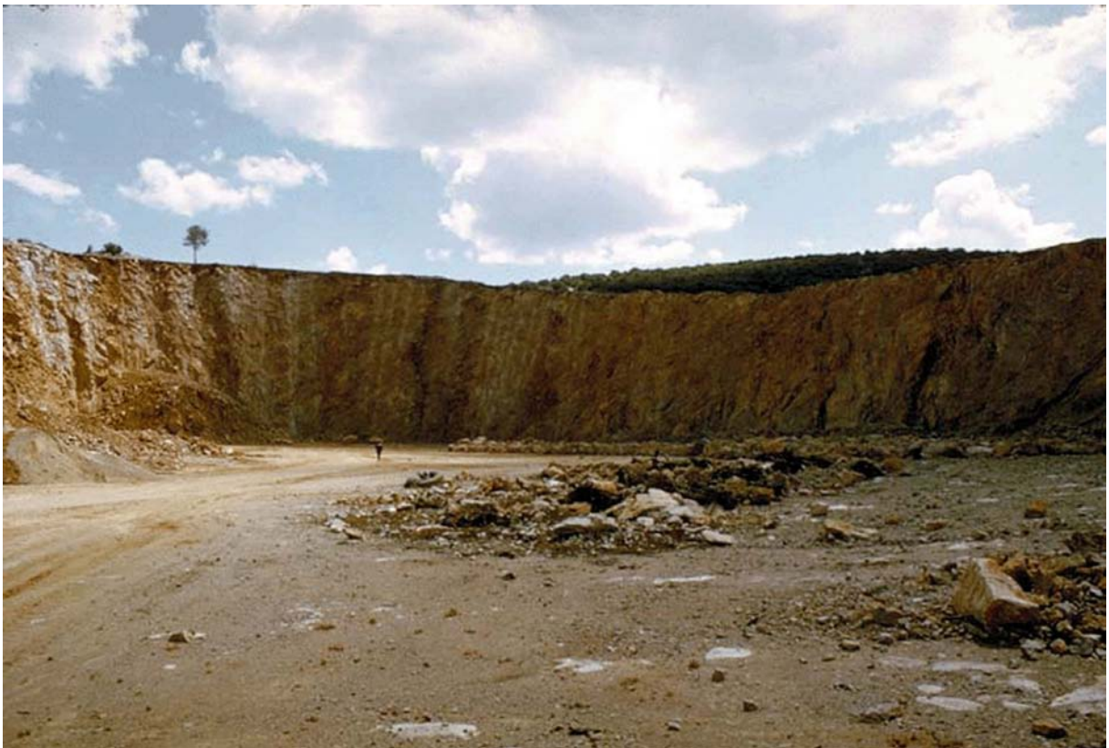
Canteras. Molins de Rei, 1974.

Els homes tenim un origen únic i anem en la direcció de formar una sola germanat; les nacions, les races, les cultures es barregen i formen un destí comú per a un planeta petit en un sistema estel·lar al centre del qual nia una estrella mitjana, que navega en una regió apartada del centre d'una galàxia espiral, com n'hi ha milions. L'art és la disciplina més lliure de l'ànima humana, l'experiència artística es pot permetre la llibertat d'interferir-se amb totes les disciplines i extreure'n les parts que responguin millor al seu model de realitat. Sens dubte,