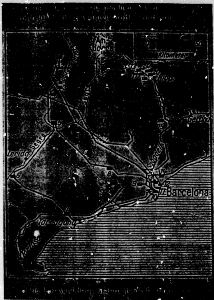
11. Línies elèctriques, segons un croquis de Julius Reichenheim (1933): són a la base d'una progressiva integració d'una part prou important del territori català.