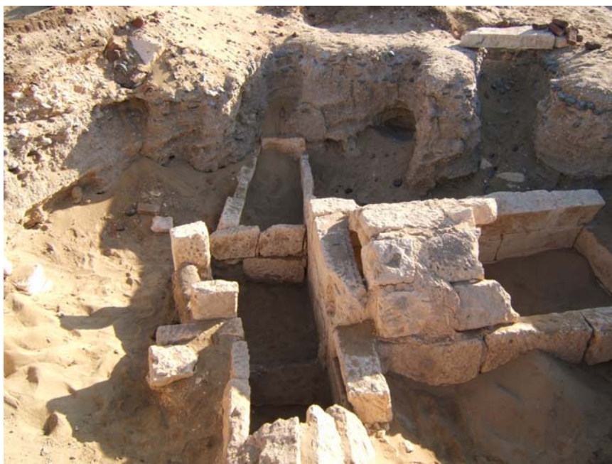
Fig. 126: Retall en la construcció de la tomba 13.

Un altre objectiu era l'estudi de la necròpolis saïta d'Oxirrinc i l'anàlisi de les característiques arquitectòniques de les tombes per tal de relacionar-les tipològicament amb altres tombes de la mateixa època. D'aquesta anàlisi es pot deduir quin era el procés de construcció de les tombes saïtes a Oxirrinc.