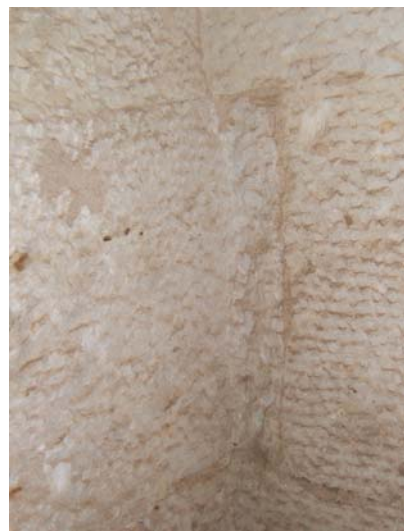
Fig. 129: Racó d'un mur de la tomba número 1.

Les superfícies internes de les parets presenten diversos tipus de tractament, des de la pedra rugosa, tal com arribava de la pedrera, fins a parets completament llises o lleugerament repicades per a la col·locació de pintures murals. Malauradament, només disposem de pintures murals a la sala 3 de la tomba número 1 i a les portes de la tomba número 7. Les primeres filades del parament (generalment són dues) presenten a les cantonades blocs que estan preparats per poder sostenir el pes dels murs i les voltes. Aquests blocs no són completament rectes, sinó que es corben una mica per tal de fer l'angle de la cantonada ( fig. 129 ). La resta de filades s'anaven modificant en funció de la corbatura de la volta.