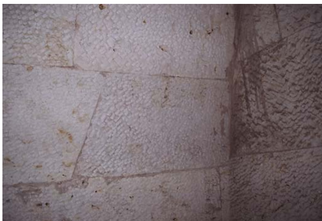
Fig. 128: Bloc trapezoïdal procedent de la tomba número 1.

La pedra calcària amb la qual es feien els blocs procedia, amb tota probabilitat, de les pedreres de Minia, ja que prop del jaciment no s'observa la presència d'aquesta pedra. Alguns dels blocs presenten nòduls petits ferrosos, que, atesa la profunditat a la que es troben les tombes i a l'augment del nivell de la capa freàtica, fan que es deteriori la pedra. Els mòduls arquitectònics són realitzats amb carreus de pedra calcària de mides molt regulars: 1 metre de llargada, entre 0,80 m i 1 m d'amplada i ½ metre d'alçària, units amb morter de calç de color rosat. A la superfície s'han trobat els elements necessaris per arreglar els murs i arrebossar-los amb una capa de morter. Molts dels blocs que es troben a la tomba són trapezoïdals ( fig. 128 ), per tal de poder trabar-los millor a l'hora de fer el parament. Els blocs 487 tenen una mica de xamfrà per tal de deixar passar el morter per sota, tècnica que es generalitza en època saïta.