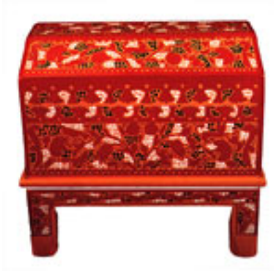
Figura 31. Baúl de madera laqueada; Ejemplo de producto de producción popular mexicana con elementos decorativos fitomorfos y zoomorfos figurativos.

Dimensiones que caracterizan y conforman los sistemas decorativos: Las pautas de organización de los sistemas ornamentales