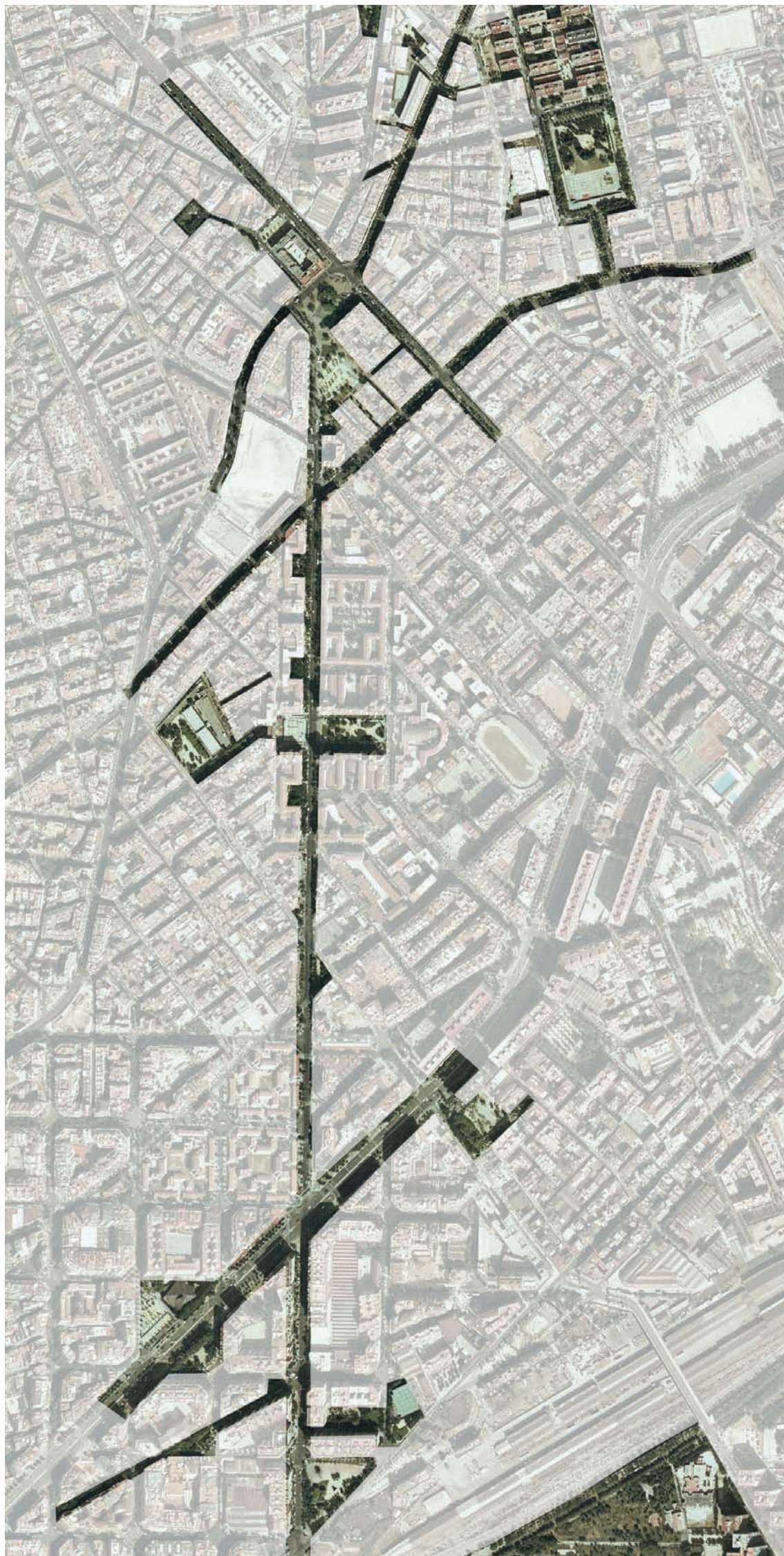
3.205 De Karl Marx a Litoral. Itinerario 5. Secuencia 2