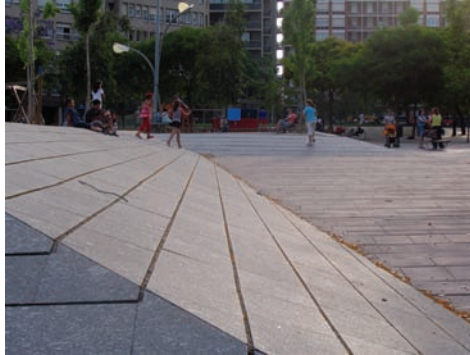
3.207 Pl. Virrey Amat