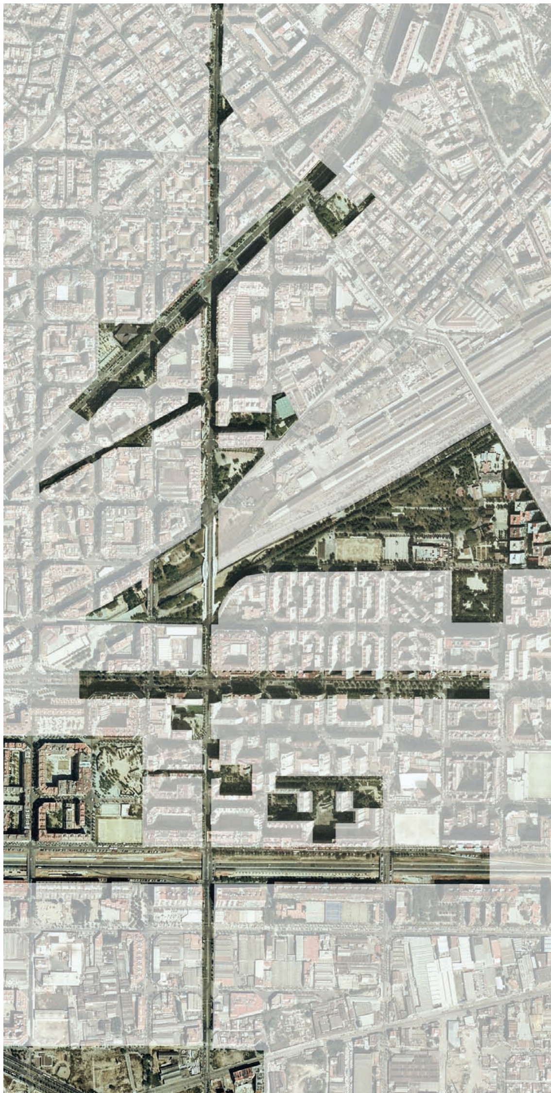
3.211 De Karl Marx al Litoral. Itinerario 5. Secuencia 3