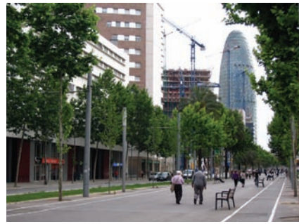
3.184 Av. Diagonal hacia Glòries