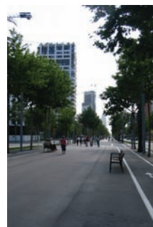
3.191, 3.192 Nuevo perfil en la Av. Diagonal