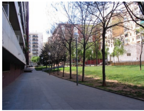
3.212 Jardines interiores c/ Hondures