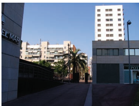
3.224 Jardines de Joan Fuster