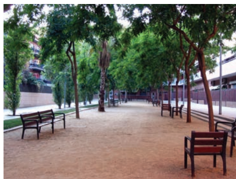
3.217 Clot de la Mel