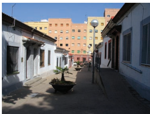
3.203 Casas baratas Ramón Albó