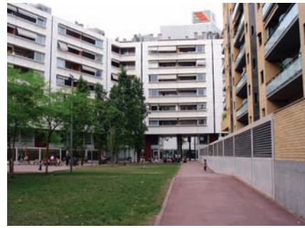
3.188 Jardines interiores vivienda Poblenou