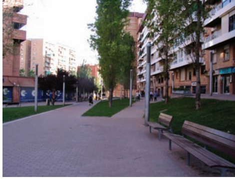
3.205 Pg. Verdum