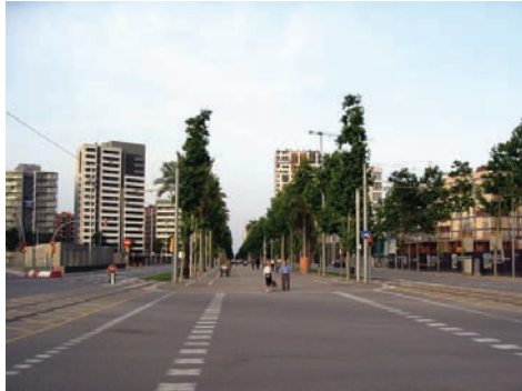
3.221 Av. Diagonal c/Pere IV