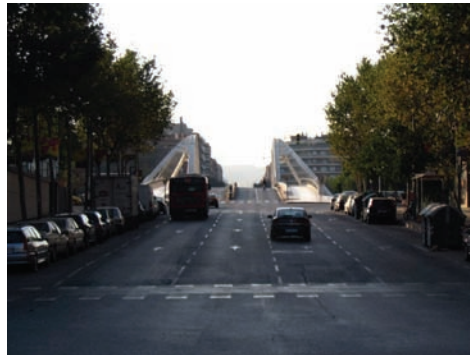
3.214 Puente Bac de Roda