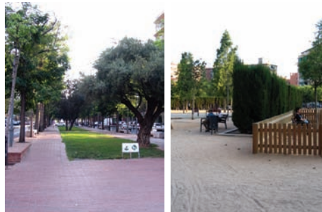
3.215 Rambla Guizpuzcoa 3.126 Clot de la Mel