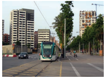
3.189 Av. Diagonal con C/ Pere IV