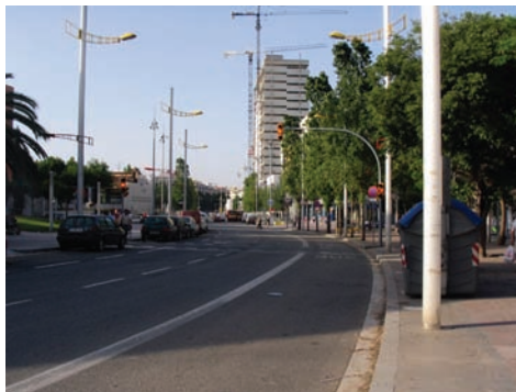
3.209 Ronda del Mig