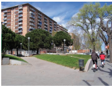
3.220 c/ del Perú