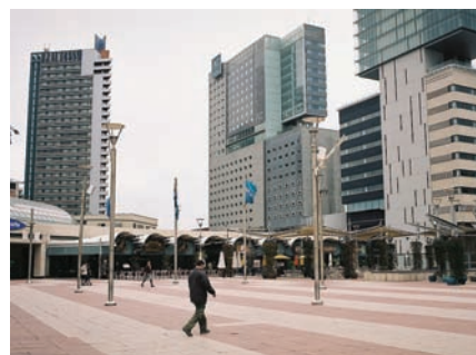
3.194 Diagonal Mar