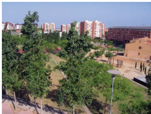
3.202 Parc Central