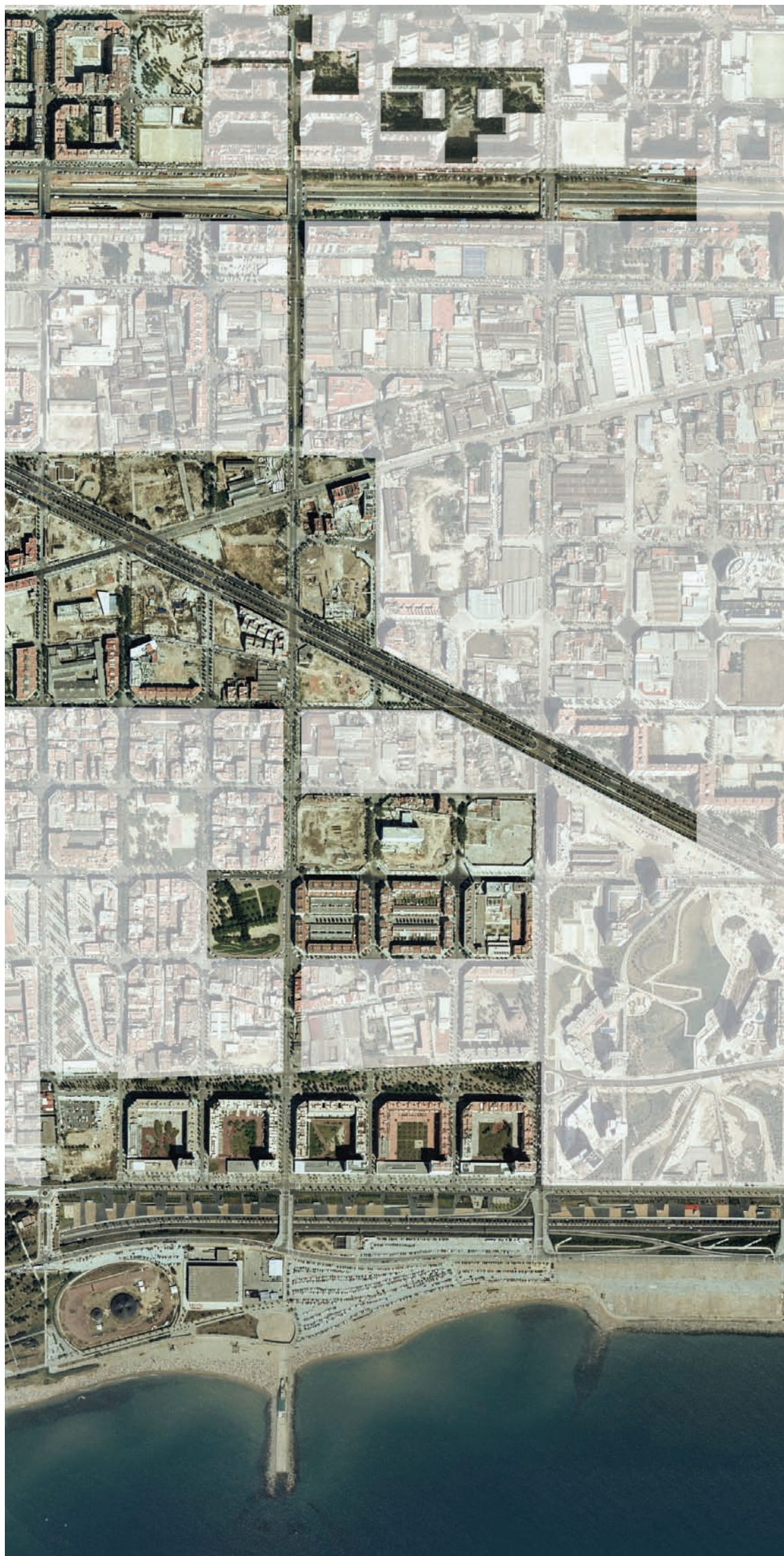
3.219 De Karl Marx al Litoral. Itinerario 5. Secuencia 4