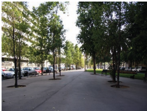
3.222 Rambla del Taulat