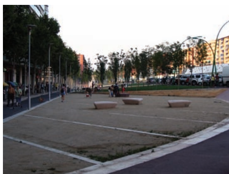
3.218 Nuevos bordes de la Gran Via