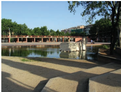
3.208 Pl. Soller