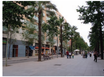
3.186 Rambla del Poblenou