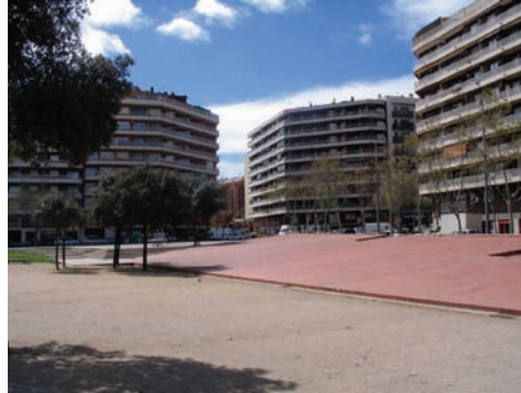
3.213 Pl. General Moragues