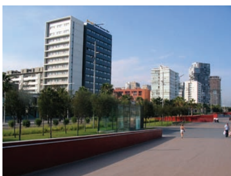
3.225 Pg. de García Faria