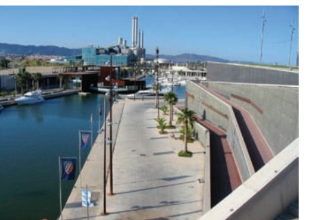
3.196 Puerto Sant Adrià del Besòs