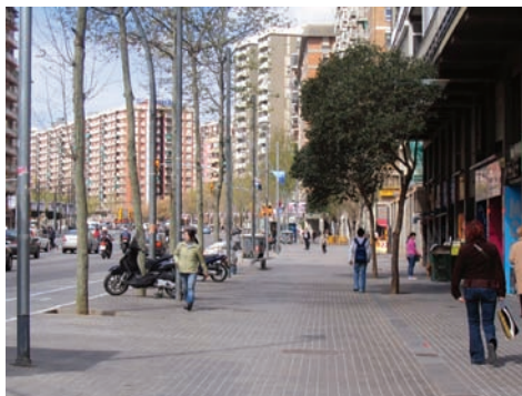
3.210 Av. Meridiana