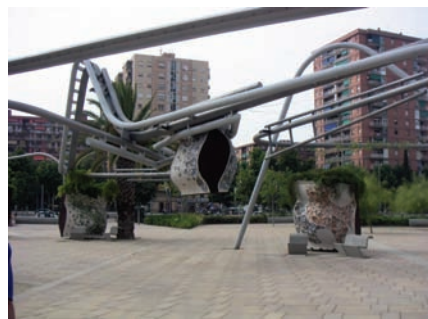
3.193 Parc Diagonal Mar