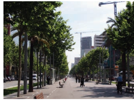
3.185 Av. Diagonal hacia Fòrum