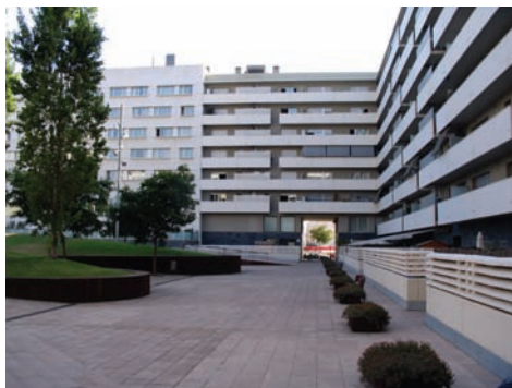
3.223 Jardines de Jaime Gil de Biedma