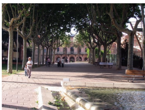
3.204 Pi i Molist hacia el Parc Central