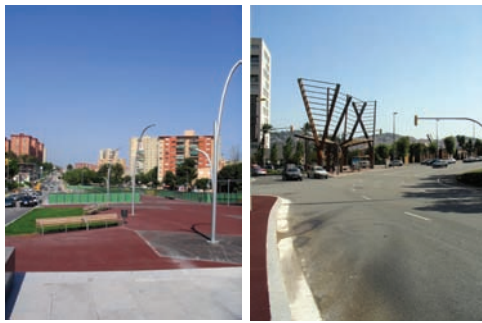
3.198 Via Favencia 3.199 Pl. Karl Marx