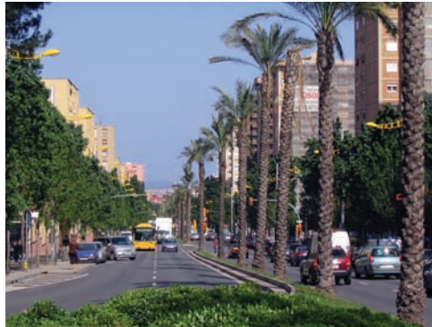
3.200 Pg. Valldaura