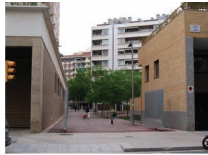
3.187 Jardines interiores vivienda Poblenou