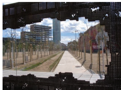
3.190 El parc Central del Poblenou