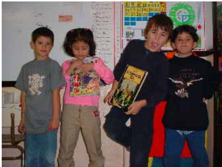
Il·lustració 8.4 Perú

A banda d'aquesta participació de l'alumnat durant les sessions, lliga amb el tema del llibre de Tintín (que surt al full de la cançó), i convida a portar als nens i nenes el llibre, la pel·lícula, samarretes, etc. També la nena peruana porta una sèrie d'objectes per parlar . El Francesc deixa constància del material aportat per l'alumnat fent-li fotos .