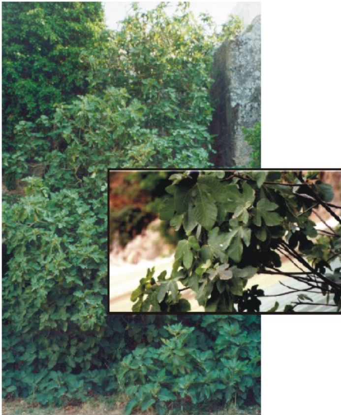
Ficus carica (Menorca, Islas Baleares)

Es una especie típicamente mediterránea que crece de forma natural en encinares y otras formaciones. En estado natural es un árbol rupícola. Su madera no es buena como combustible y es de mala calidad, en cambio, los higos son muy apreciados para el consumo.