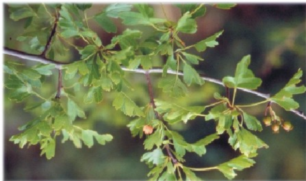
Crataegus monogyna (Sierra de Atapuerca, Burgos)

Este grupo incluye numerosas especies, la mayoría frutales cultivados en la actualidad como: Malus domestica (manzano), Cydonia oblonga (membrillo), Pyrus domestica (peral) y otras silvestres como Sorbus aucuparia (serval silvestre), Sorbus aria (mostajo), Amelanchier ovalis (guillomo), Crataegus monogyna (majuelo) entre otras muchas. En su forma no cultivada, crecen de forma natural en Cataluña abundantemente el serbal y el majuelo, distribuidos en zonas húmedas de la Muntanya Mitjana . Se trata de árboles o arbustos que crecen en regiones de montañas y en el piso supramediterráneo como el manzano, el serval, el majuelo. Se han explotado básicamente por sus frutos y las propiedades curativas de algunas de las especies.