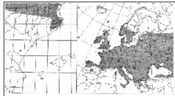
Distribución actual de Pyrus malus