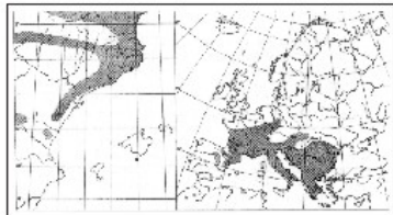
Distribución actual de Sorbus domestica