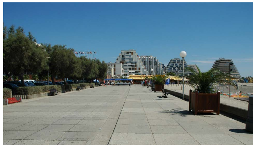
Figura 7-2. Zona de playa, estación turística La Grande-Motte.