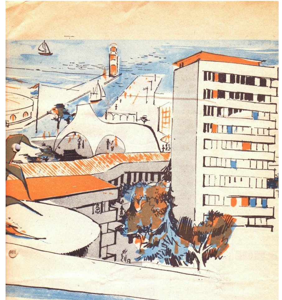
Figura 7-1. Cartel publicitario para promover el turismo en Languedoc-Roussillon.

El Equipo Candilis-Josic-Woods, participantes activos de este grupo, experimentaron sobre los elementos de articulación vertical y horizontal de los edificios de viviendas en diversos