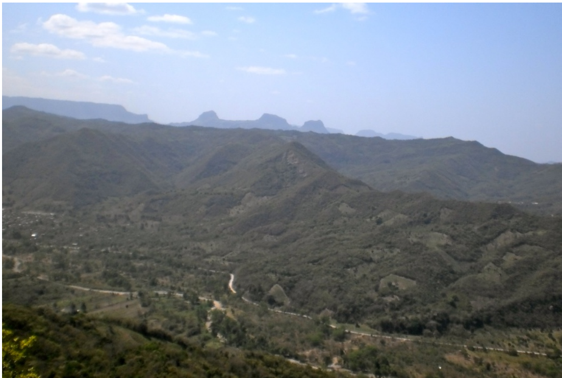
Figura 3 . Tlaixnestli tlen ni kuestekapaj kuatitlamitl.

Kampa achi tlaixko nimaj nesi kampa maseualmej tlaixuitejtokej (Dirzo uan Miranda, 1991). Ni kuatitlamitl tlen achi miyak eltok yani tlen chamani kemaj miltekitij uan teipaj eli milkauali uan nikaj chamanij kuatinij kemej Bursera simaruba (L.) Sarg. ( chakaj o kuaxiyotl ), Cedrela odorata L. ( teokuauitl ), Croton draco Schlecht. ( eskuauitl ), Guazuma ulmifolia Lam. ( akichkuauitl ), Havardia albicans (Kunth.) Briton et. Rose. ( hujmo ), Parmentiera aculeata DC. ( chote ), Platanus mexicanus Moric. ( akuauitl ) ya ni tlen achi nesij.