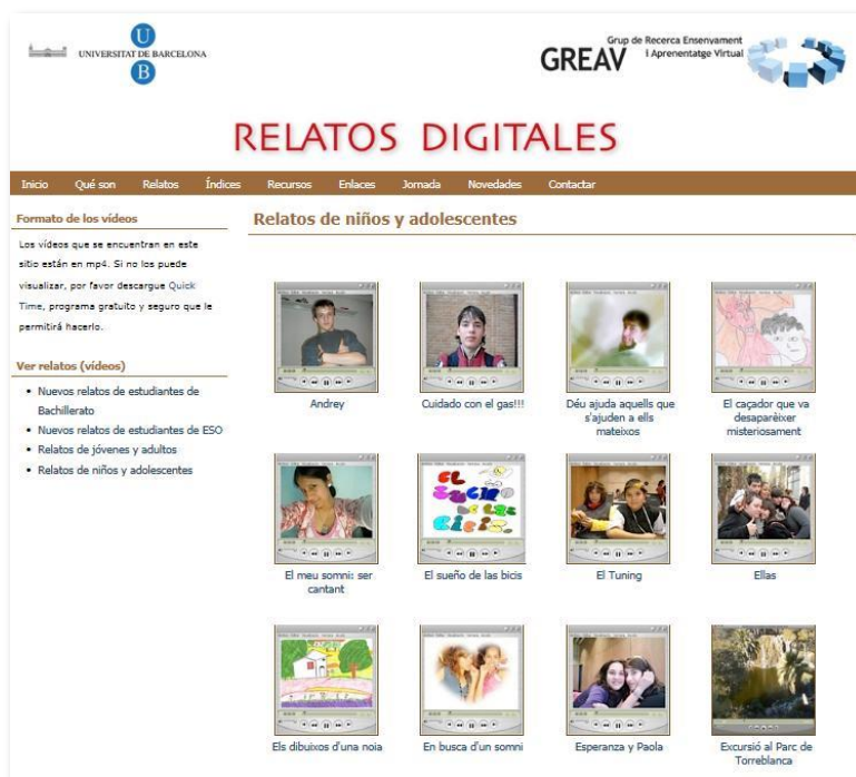
Gráfica 1: Copia de pantalla del sitio Web Relatos Digitales, creado por el OED http://greav.ub.edu/relatosdigitales

La autora de esta tesis, además, se desempeña como coordinadora y administradora de contenidos de dichos sitios Web. Se anexa copia de las pantallas.