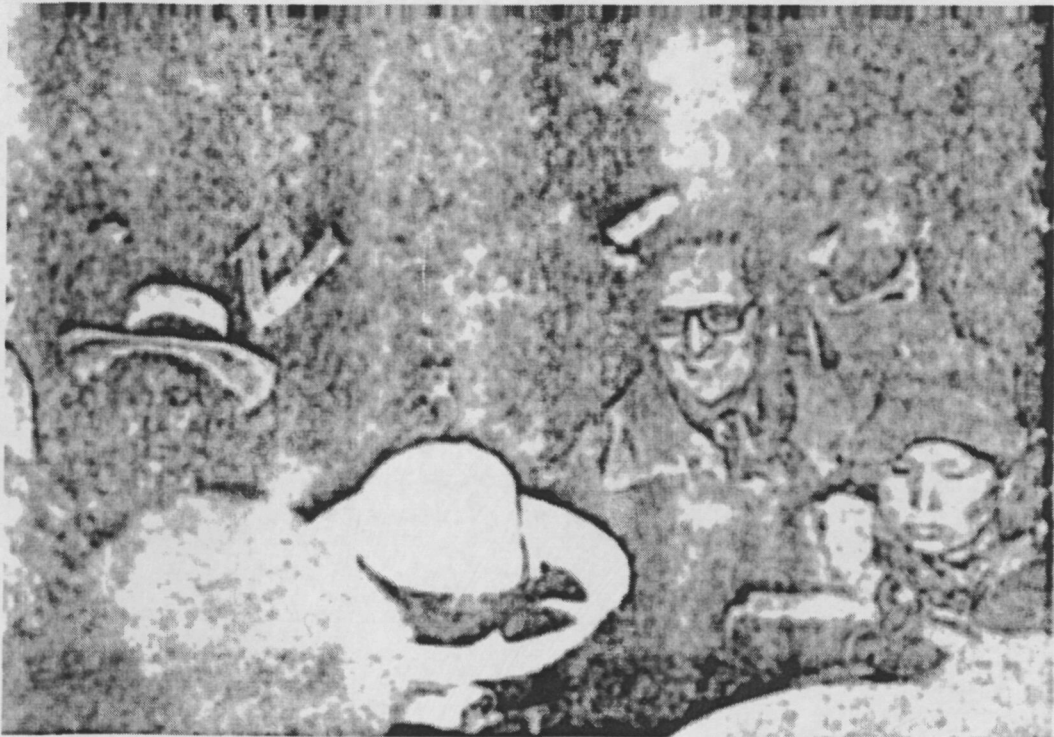
Ilustración 12: Manuel Scorza en Yanacocha.