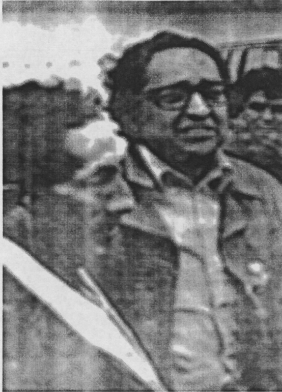
Ilustración 10: Manuel Scorza y Héctor Chacón.