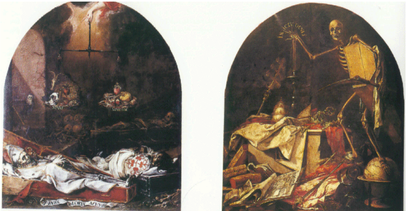
Juan de Valdés Leal, “Jeroglíficos de las postrimerías: In ictu oculi i Finis gloriae mundi ”, 1672. Hospital de la Caridad, Sevilla.