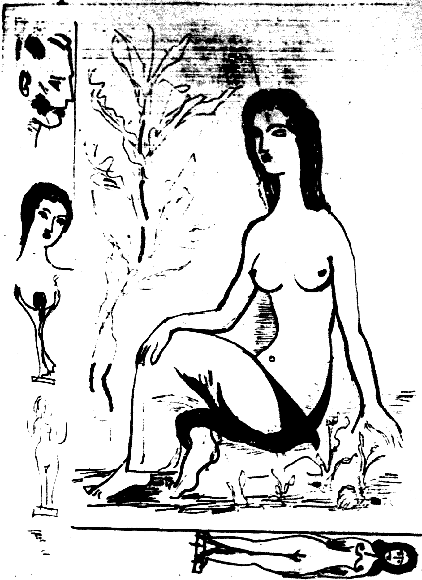
Gravat d'APELLES FENOSA per a la Col·lecció GRAVURE ET POÉSIE DE CE TEMPS no publicat.