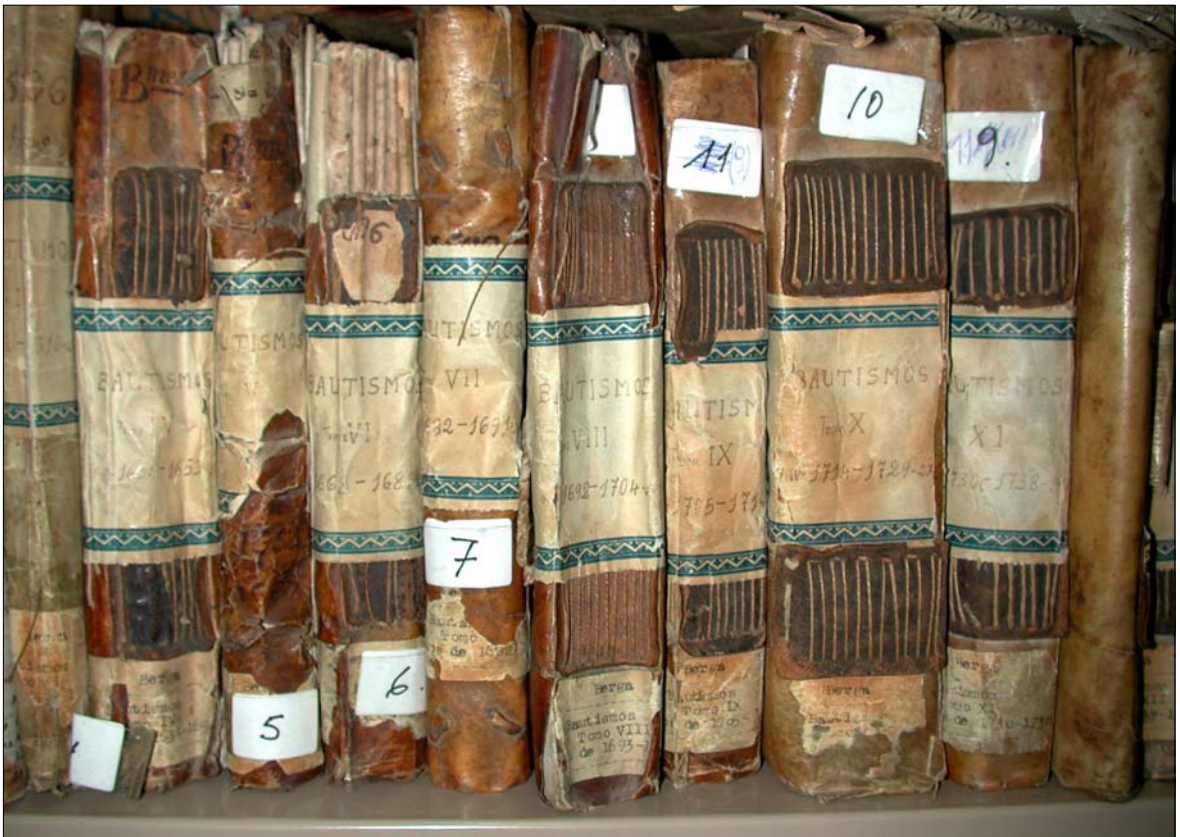
Dos detalls de les prestatgeries de l'Arxiu Diocesà de Solsona, on es conserven els llibres sacramentals de la parròquia de Santa Eulàlia de Berga