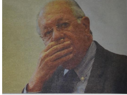
La Tercera, 09.06.2005