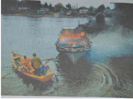
La tercera, 21.10.2007