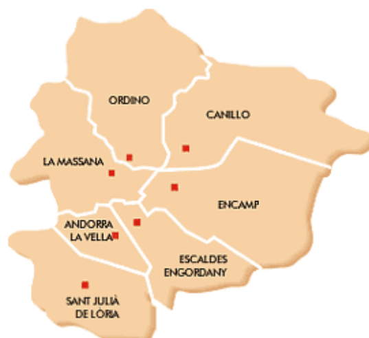
Figura 1. Mapa d'Andorra

Les diferents parròquies que conformen el Principat d'Andorra, presenten diferències socioeconòmiques remarcables. Andorra la Vella és on es concentra la major part de la població, amb un caràcter més "urbà" que la resta de les altres parròquies, i on el pes de la immigració es fa més patent. A continuació es presenta la Figura 1 -mapa d'Andorra-, en la que es pot observar la localització i la distribució de les diferents parròquies.