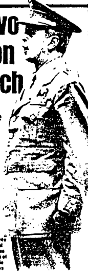
El teniente general Gabeiras inauguró el turno de testigos

El testigo militar dijo que Armada obró inaceptablemente Madrid. - El teniente general José Gabeiras Montero, ex jefe del Estado Mayor del Ejército, ratificó ayer ante el tribunal que juzga a los procesados por el 23-F que el general Jaime Milans del Bosch «estuvo desobediendo reiteradamente mis órdenes» la noche del golpe. Las declaraciones de Gabeiras «primer testigo que desfila por el juicio» concuerdan a hitos del Bosch, que reaccionó con gestos de desagrado y fuertes exclamaciones. En cuanto al general Alfonso Armada, Gabeiras dijo que su actitud el 23-F no fue de apoyo a los rebeldes pero que era «totalmente inaceptable y anticonstitucional» su pretensión de postularse para presidente del Gobierno. El general Gabeiras sufrió un duro acoso por parte de los abogados de los procesados, que en muchas ocasiones debió portar el presidente. (Páginas 10 a 12.)