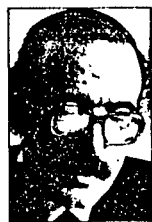
García Díez, el ministro que protagonizó el Consejo de Ministros