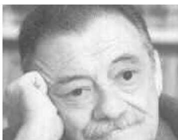
Mario Benedetti, 1967