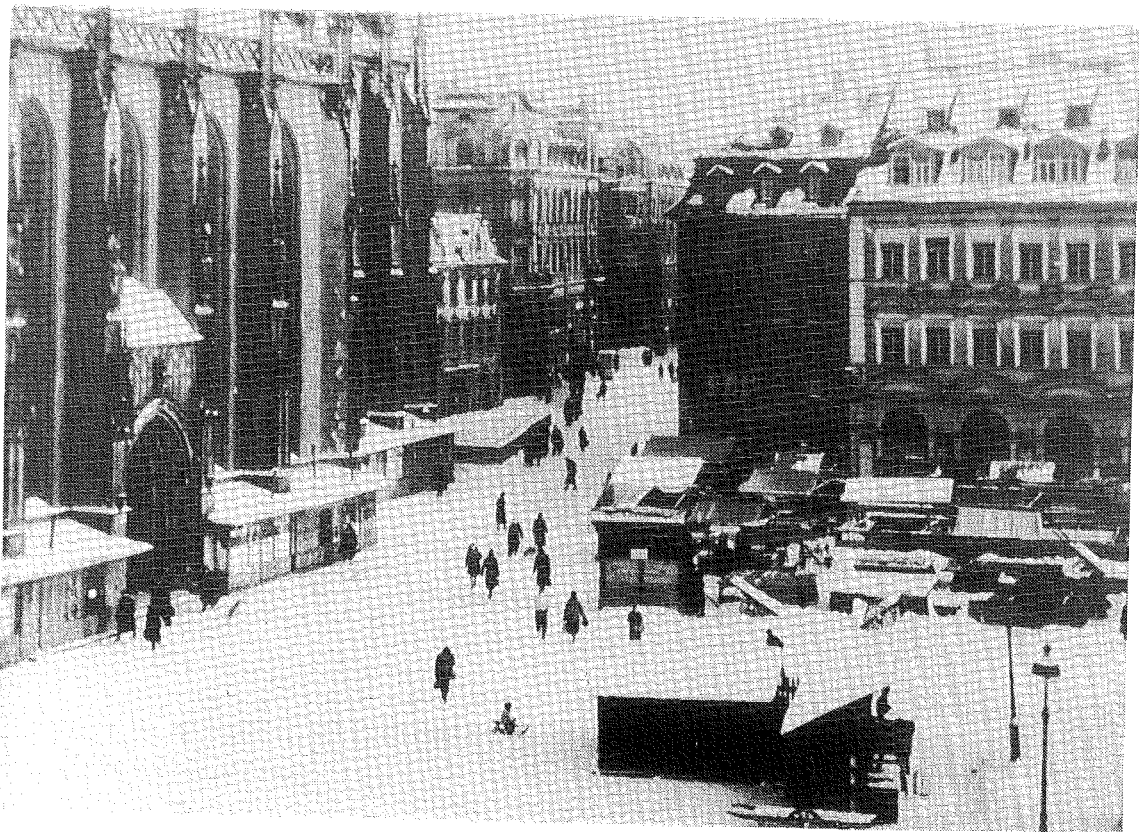
WÜRZBURG (1944/1945) Imagen de la plaza del mercado (Marktplatz) en invierno