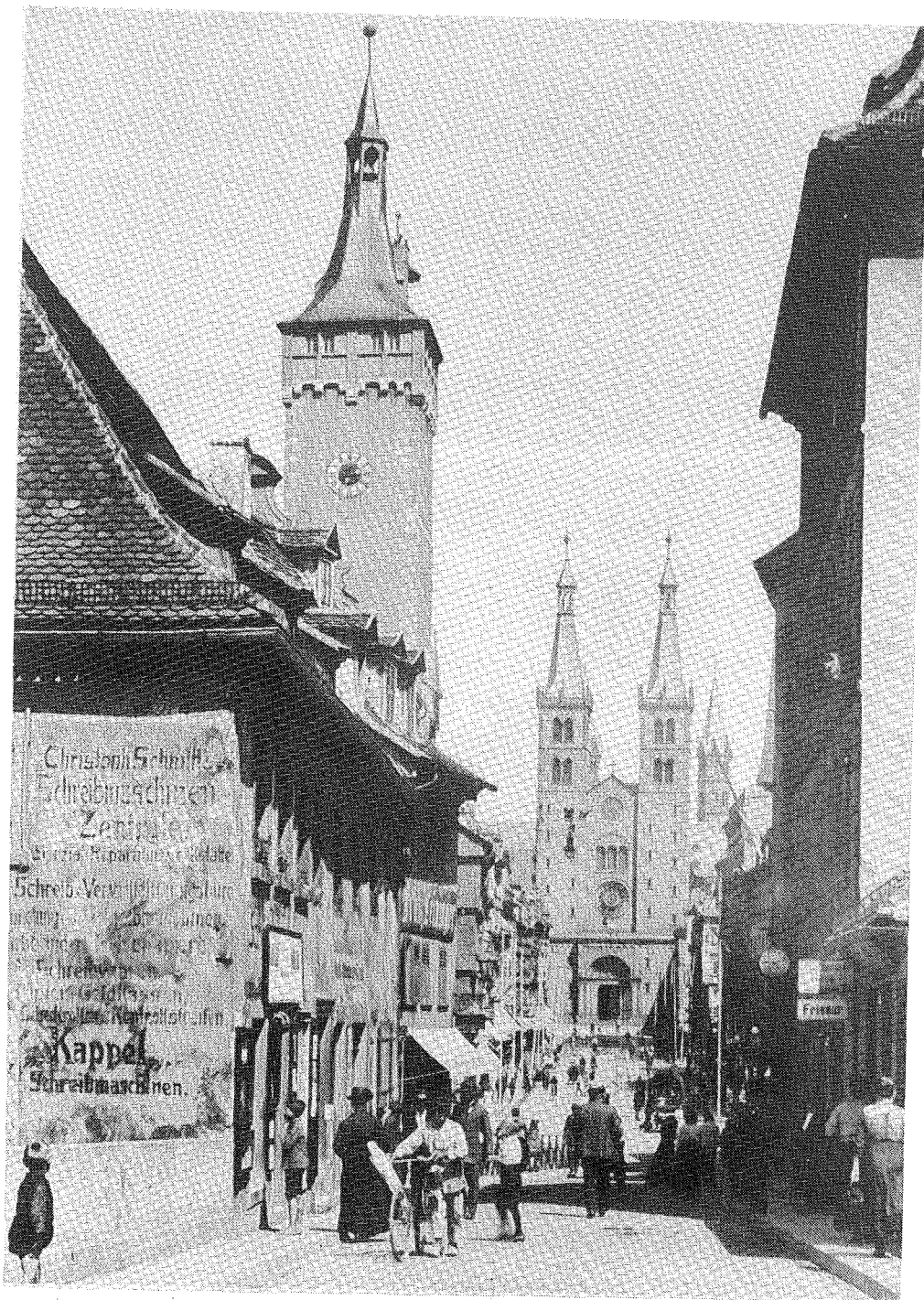
WÜRZBURG (1924) Imagen típica del centro con vistas a la catedral (Domstraße)