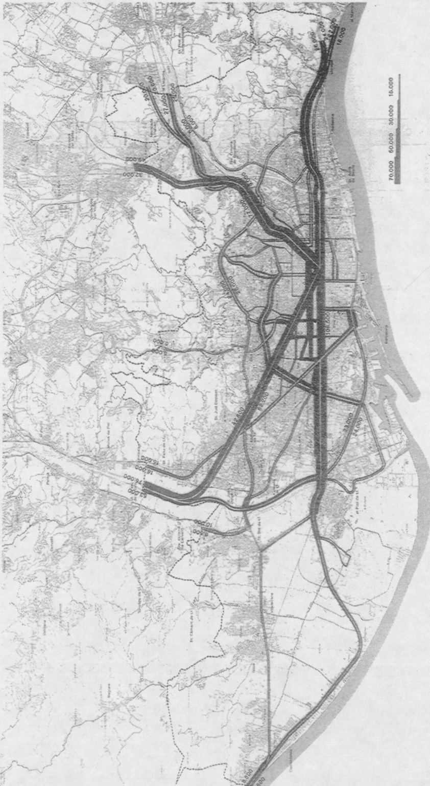
Mapa 6.28 ARANYA DE TRÀNSIT DE LA XARXA VIÀRIA BÀSICA DE BARCELONA (1990)