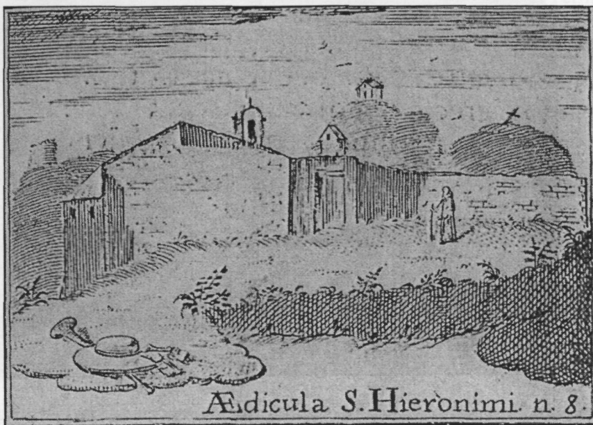
L'ermite de Sant Jeroni segons el Compendio historial (a dalt) i les Vistas de Montserrat (a baix).