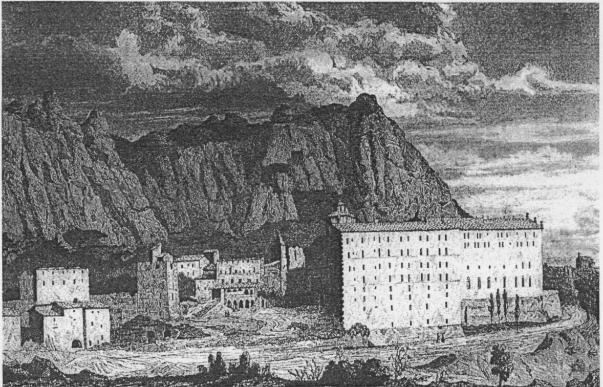
Gravat fet per Lluís Rigalt per a l'obra El Mansueto o las cuevas de Montserrat (1860)