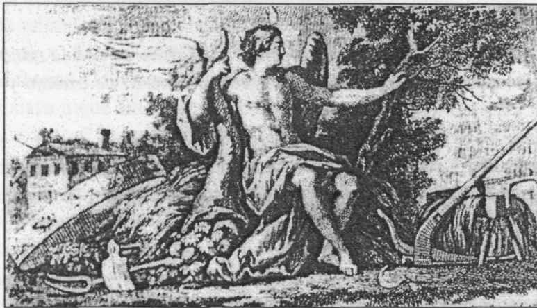
Portada del primer número del Semanario de Agricultura y artes dirigido a los párrocos (1797).

“El magestuoso teatro en que se verifican las ocupaciones de la agricultura las da un valor que no tienen las demas, ¿quál es el arte que se exerce en medio de las mas bellas escenas de la creacion, y baxo la inmediata influencia de los fenómenos celestes? El labrador nunca dexa de mirar con interes los dulces rocios, las lluvias criadoras, los vientos, las nieves y las escarchas: si brilla y calienta el sol, es para madurar sus cosechas; si le cubren las nubes es para regarlas; y si los temporales excitan sus temores, tambien son un remedio contra la insensibilidad, y la indiferencia; y dan nuevo valor á los frutos que perdonaron” 1 .