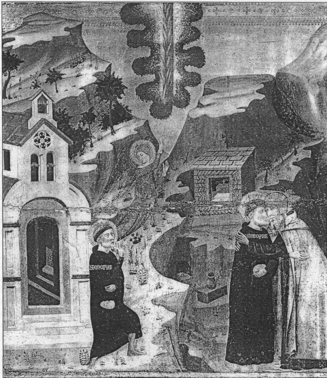
Retaule de Sant Onofre, Catedral de Barcelona.

és que, com ja hem dit, la fotografia fa impossibles les imatges impossibles. Les seves formes simbolitzen una altra relació amb l'espai: una relació amb un únic punt de mira, sense profunditat ni temps; una relació per a nosaltres evident perquè ens sembla que és l'única possible.