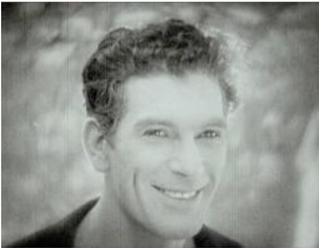
Primer plano en Rien que les heures

La contemporánea Rien que les heures , como Chapman advertía, ponía énfasis en los rostros de los paseantes, e incluso no dudaba en insertar fragmentos de ficción para acercar al espectador un poco más a la vida de los parisinos –aunque insistimos en que siempre manteniendo una relación de relativa exterioridad. Su cámara prefiere no tanto los grandes bulevares y paseos fluviales del París de suvenir , como los callejones traseros y oscuros del París popular, siempre transitados por individuos. Las didascalías preliminares de Rien que les heures rezan que no vamos a contemplar la vida elegante, sino la de las clases humildes.