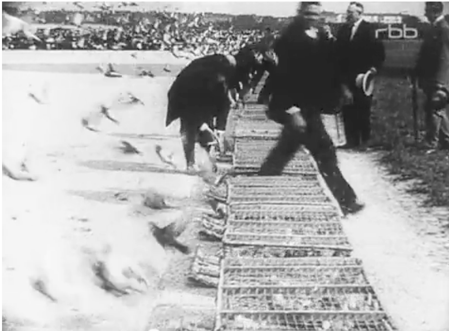
Imagen del V acto de Berlín, sinfonía de una gran ciudad

Simmel aparentemente aborda la posibilidad de remitir esta situación de embotamiento de los sentidos de una manera un tanto superficial, y no ofrece una reflexión explícita sobre la forma que debería tomar una exposición comprometida con la diferencia. No obstante, en sus textos se van perfilando los rasgos de lo que podría ser un arte de la exposición. Por ejemplo, Simmel llama la atención acerca de la preponderancia de lo visual sobre el resto de los sentidos en las grandes ciudades. En una de sus espléndidas viñetas, considera que “los ojos desempeñan una función sociológica particular: el enlace y acción recíproca de los individuos que se miran mutuamente”, y apunta que “acaso sea esta la relación mutua más inmediata y más pura que exista” (Simmel, 1986 [1908]: 677). La mirada desempeña una función tan fundamental que “todo el trato entre los hombres, sus acuerdos y sus repulsiones, su intimidad y su indiferencia, cambiarían de un modo incalculable si no existiese la mirada cara a cara” (Simmel, 1986 [1908]: 678), porque en el mismo acto de mirar, uno se manifiesta a sí mismo, revela parte