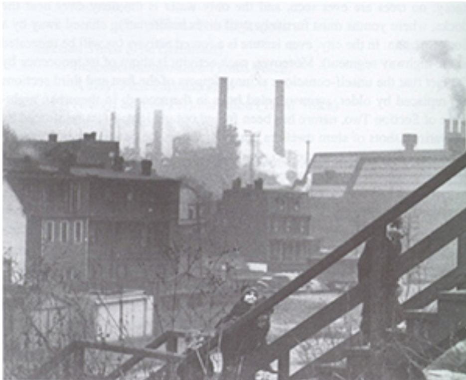
Fotograma de The city

Tras la Segunda Guerra Mundial, el homenaje más vibrante a la vida urbana viene de la mano de Donn Alan Pennebaker, con Daybreak Express (1953), una breve pero sugestiva mirada al transporte ferroviario urbano, al compás del frenético ritmo de la trompeta de Duke Ellington en el tema homólogo.