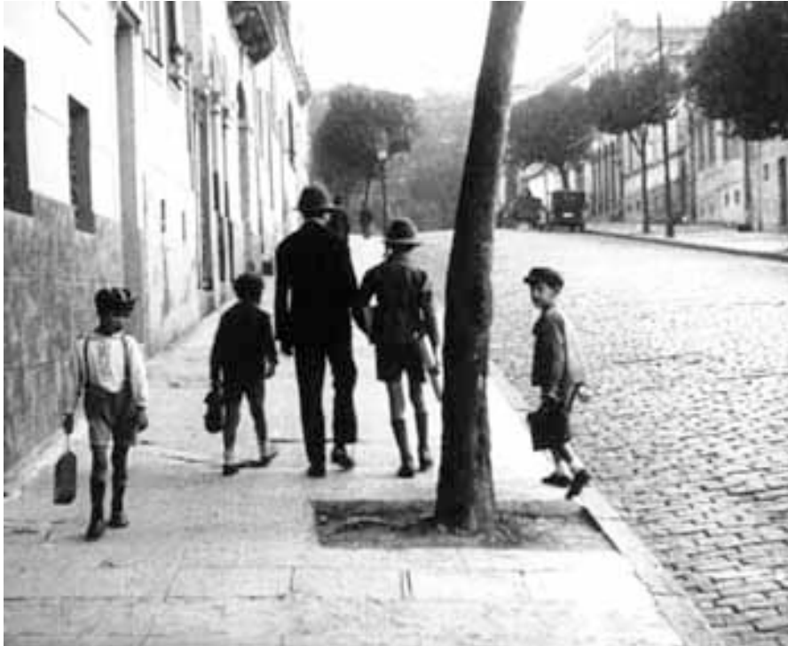
Niños en São Paulo sinfonía da metropole

énfasis en la aportación que los inmigrantes hacen a la ciudad de São Paulo (no olvidemos que los mismo realizadores lo eran). La cinta construye una perspectiva optimista y no exenta de cierta actitud acrítica ante la idea de progreso de la nueva modernidad que comenzaba a caracterizar a la cotidianidad paulista.