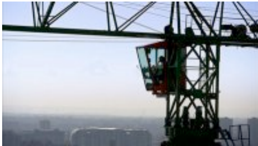
Fotograma de The Solitary Life of Cranes

Otra de las tentativas de mirar la exterioridad urbana partiendo del extrañamiento nos la ofrece Eva Weber en The Solitary Life of Cranes (2008), una invitación a explorar 24 horas de la vida de Londres desde la privilegiada pero solitaria perspectiva de las cabinas de las grúas, desde donde uno puede entregarse, como decía el primo del cuento de Hoffman (2006), a las habilidades de un verdadero “arte de mirar”, aunque conservando siempre la distancia con lo observado.