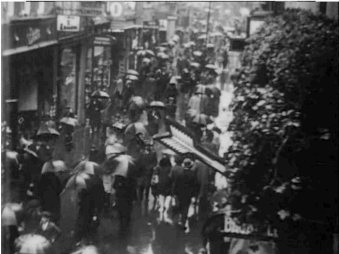
Calle abarrotada de paraguas en Regen

herencia futurista. Por las mismas fechas, Eugène Deslau se deleita con imágenes de los rincones insólitos del distrito parisino de Montparnasse, en el filme del mismo nombre. Allá la cámara se encuentra con artistas y celebridades –entre ellos Luis Buñuel, Le Corbusier, Foujita o Kiki de Montparnasse–, compartiendo espacio con rebaños de cabras, payasos y vagabundos. A Deslau, uno de los elementos más interesantes y menos conocidos de la vanguardia cinematográfica europea de la época, le debemos incluso una insólita sinfonía nocturna: Les nuits électriques , de 1928.