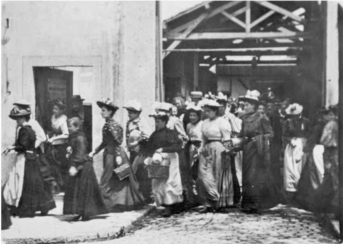
Fotograma de La salida de los obreros de la fábrica

semejante no sólo habría sorprendido a aquellos hermanos pioneros del cinematógrafo sino quizá también incomodado, ya que aquello que la película buscaba no era contar , sino aprehender todo aquello que se veía en la imagen, todos sus detalles cambiantes y sus combinaciones aleatorias. Esta intención fuertemente indéxica de las primeras películas Lumière parece corroborarse con el dato de que era práctica corriente en aquel momento pasar las películas varias veces seguidas en una misma sesión, de tal manera que, presumiblemente, el espectador pudiera alcanzar una conciencia de lo que estaba sucediendo en las cinta. Parece impensable que el público de finales del siglo XIX pudiese considerarse satisfecho después de visionar aquellas películas una sola vez, ya que llevaban inscrita la necesidad de ser vistas varias veces. “Es la naturaleza misma sorprendida in fraganti”, exclamaban con asombro admirado los primeros críticos. [...] A diferencia de Dickson, el creador del cinematógrafo había rechazado los medios del teatro;