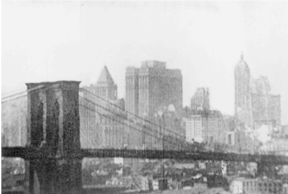
Rascacielos en Manhatta

Cinco años más tarde, en 1926, Alberto Cavalcanti ofrece una mirada profundamente diferente y humana sobre lo urbano en Rien que les heures , a través de la imbricación de dos tipos diferentes de material, uno rodado directamente en las calles del natural y otro preparado en localizaciones específicas con actores. Rodada en las calles de París, el filme del director y arquitecto brasileño propone una visión opuesta a la de Ruttmann, que esbozaremos a continuación, fundamentalmente centrada no ya en el movimiento de la urbe como gran engranaje suprahumano, sino en la escala y los contrastes humanos en la ciudad moderna. Cavalcanti abandona el París de suvenir para centrar su foco en una visión comprometida con lo urbano, pero en oposición a la perspectiva complaciente de los pintores frente al Sena, Cavalcanti se mueve entre callejones traseros y patios interiores para hallar en ellos el componente humano que los transita.