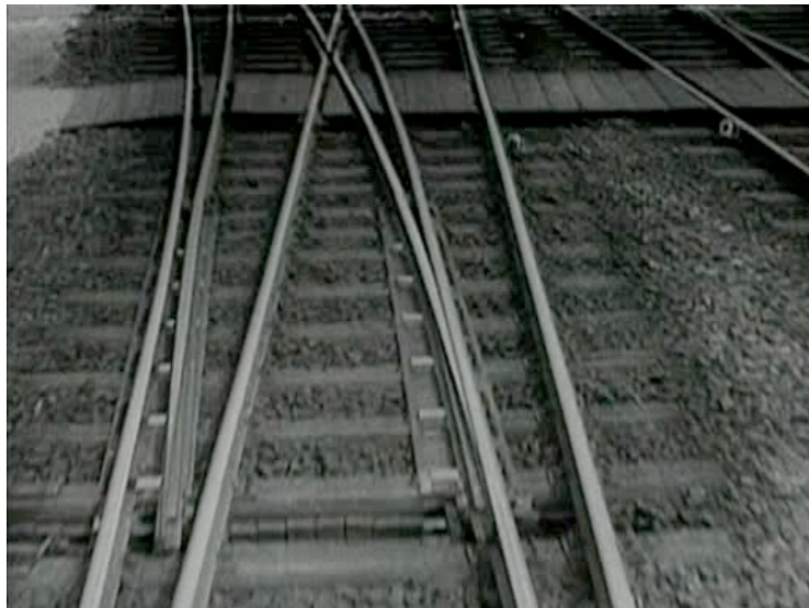
Fotograma de Berlín, sinfonía de una gran ciudad

de la ciudad viene reforzada por los seres que transitan las calles del Berlín de Weimar, que han perdido su condición individual para convertirse en meros componentes anónimos de la multitud. Es Chapman (1979: 37, 39-40) quien contrasta el tratamiento de la multitud en el filme de Ruttmann y en Rien que les heures , de Calvalcanti, y apunta a que mientras Cavalcanti centra su mirada en los transeúntes en cuanto individuos, Ruttmann lo hace en cuanto partes integrantes y anónimas de la multitud. Para Ruttmann la esencia de lo urbano es su ritmo, y poco más que su ritmo (Chapman, 1979: 40).