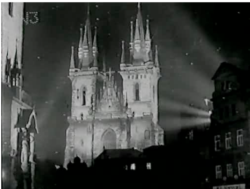
Arquitectura nocturna en Praha v záři svetel

También en 1927 Ilya Kopalín y Mikhail Kaufman ruedan Moskva , una aproximación a la urbe moscovita en el décimo año de la revolución, en plena actividad industrial y económica. Un año más tarde, en 1928, aparece Praha v záři svetel , de Svatopluk Innemann. La película, realizada por encargo de una empresa de energía, captura tanto la exuberante actividad nocturna de Praga como su esplendor arquitectónico.