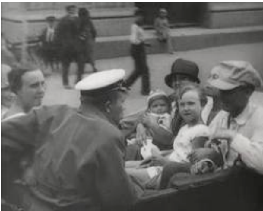
Niños en El hombre de la cámara

los entresijos del espacio urbano como si fuera por primera vez, con la mirada renovada y liberada del peso de la costumbre. Esta renovación de la mirada que los acontecimientos revolucionarios habían hecho posible era especialmente perceptible a través del cine, cuya presencia era constante y fundamental en la capital soviética, con Vertov o Eisenstein a la cabeza. No parece descabellado asegurar que este cine soviético de temática urbana sería el modelo representacional para los paisajes urbanos de Benjamin.