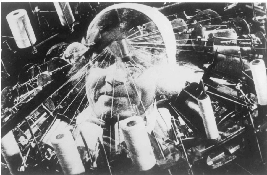
Superposición de imágenes en El hombre de la cámara

En El hombre de la cámara , claramente se puede observar la tentativa de Vertov de mostrar esta armonía entre ser humano y máquina, una armonía que se alcanza a través de la iluminación de las imágenes constituidas en un lenguaje y que permite el despertar de la conciencia del espectador. Y en esta tentativa, Vertov parece poner en imágenes las especulaciones de Benjamin en La Obra de Arte en tiempos de su reproductibilidad técnica . Vertov utiliza estrategias de ritmo visual, montaje paralelo y superposiciones para representar, literal y metafóricamente, la afinidad entre máquina y ser humano. Un ejemplo de ello es la secuencia del despertar de la joven: Vertov establece una clara correspondencia entre el ojo, que reacciona a la luz que se filtra a través de la persiana, y la cámara, que reacciona a la luz a través del obturador. Ambos se adaptan a lo mirado a través de la pupila-diafragma, y el foco de visión. Otro ejemplo lo constituyen las analogías, a través del recurso de la superposición y el montaje paralelo, de la cámara cinematográfica y las manos de los operarios de diferentes fábricas, como las de la joven que monta las cajas de cerillas. Se trata, en ambos casos, de movimientos constantes y repetitivos, inervaciones que en este caso siguen