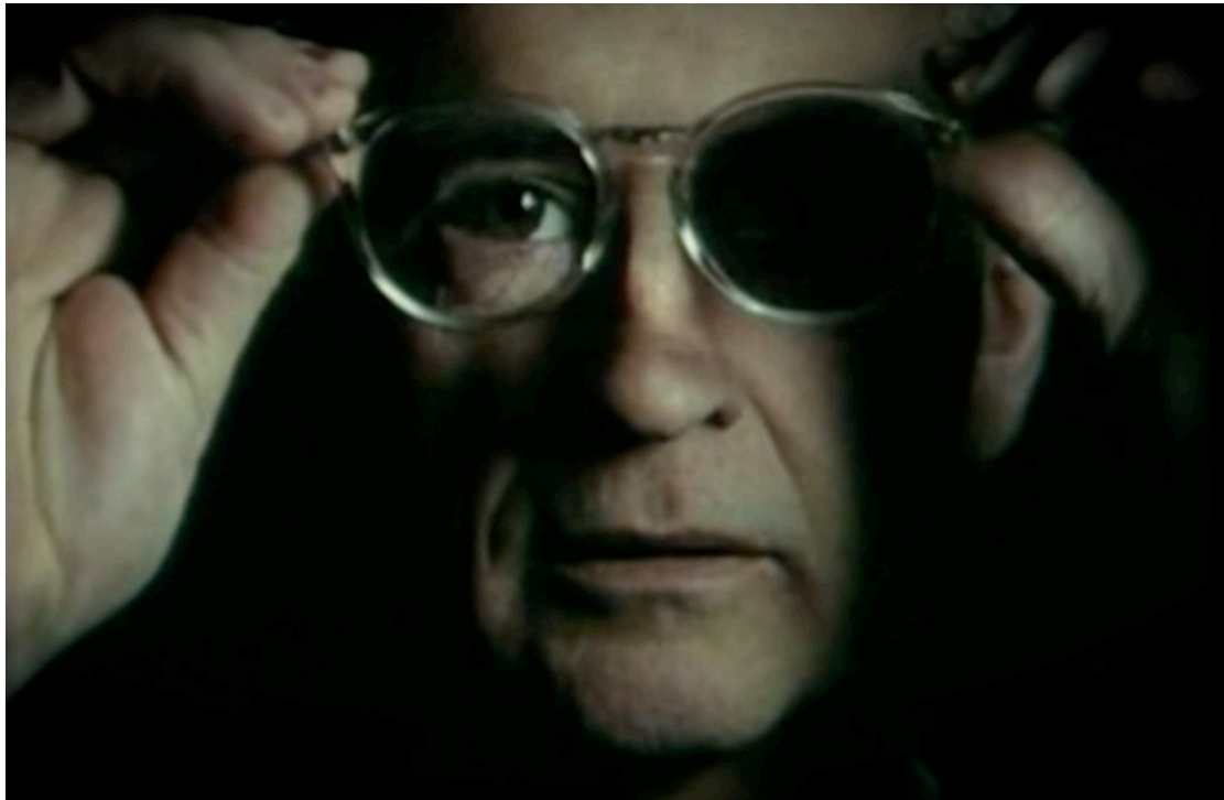
Rostro del cineasta en Face Value

En la actualidad, los esfuerzos en la reflexión sobre el acto de mirar lo urbano se han cristalizado en productos de no-ficción diferentes y diversos. Entre ellos podemos destacar Suite Habana (2003), de Fernando Pérez, que recupera la estructura de las sinfonías urbanas de los años veinte y resume en 84 minutos un día en la vida de 10 habaneros cualquiera –de las clases populares–, a través de una mirada consciente de que, con su presencia, está cambiando a cada segundo la realidad que observa.