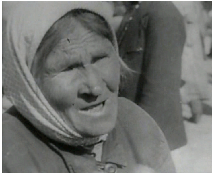
Primer plano en El hombre de la cámara

visto sea mucho más enigmático que el individuo solamente oído “contribuye, seguramente, al carácter problemático que aqueja el sentimiento moderno de la vida” (Simmel, 1986 [1908]: 681). Otra de las diferencias que Simmel