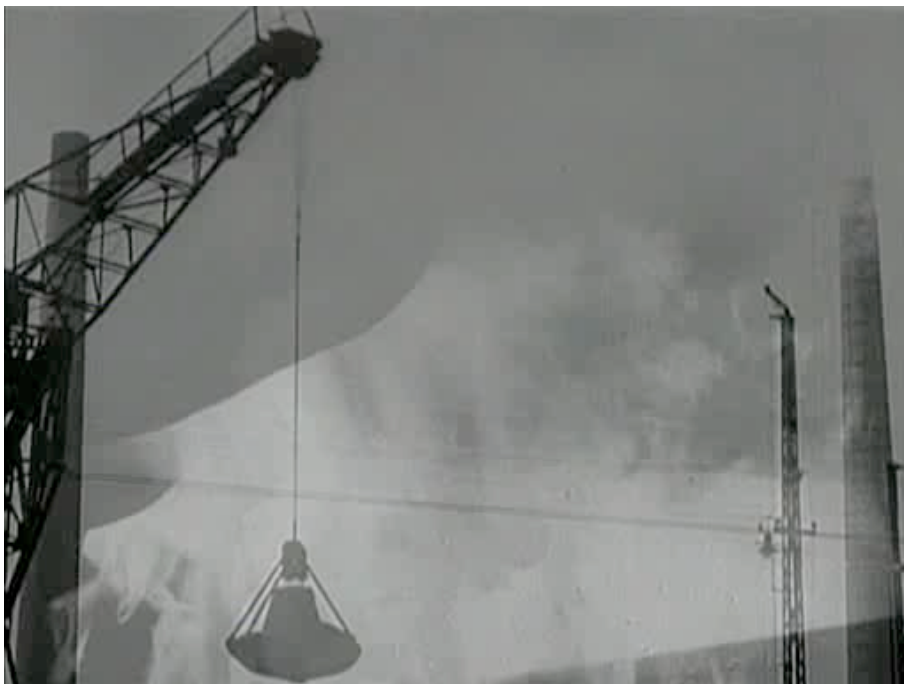
Grúa trabajando en Berlín , sinfonía de una gran ciudad

La viñeta o la situación será, por lo tanto, la unidad de análisis de las reflexiones sociológicas de Simmel. Pero ¿cual era el origen de una fragmentación de la experiencia tal que incluso afectaba la manera de abordar la realidad? ¿Dónde estaba el origen de aquella tragedia de la cultura que Simmel advertía en el contexto urbano? Antes de contestar a esta serie de preguntas, es preciso detenernos un momento para esbozar someramente una panorámica del Berlín de la época. Hacia 1920, Berlín se extendía sobre 87.600 hectáreas y albergaba 3,8 millones de habitantes. Berlín era una urbe formada a raíz de la fusión de ciudades y comunidades vecinas de distinto origen, y en las primeras décadas del siglo se hallaba en constante crecimiento, ofreciendo a quien la visitaba la sensación de urbe inconclusa, difusa, sin contornos claros. Es Ruttmann quien, en Berlín , refleja a la perfección esta imagen de urbe en la que todo está en construcción, en proceso de ser , con talleres al aire libre, edificios a medio construir y obras en la vía pública; una ciudad que a mediados de la década de los años '20 aún