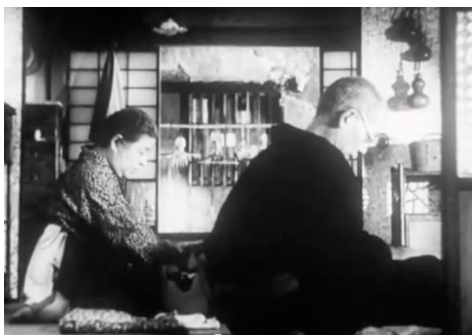
Nostalgia de la mirada de Yasujiro Ozu en Tokio-ga

En el vuelo pusieron una película. Como siempre intenté no verla y como siempre la vi. Sin el sonido, las imágenes sobre la pequeña pantalla me parecían todavía más vacías. Una forma vacía que simula e imita las emociones. Era bello mirar afuera por la ventanilla. Pensé que si fuera posible filmar así, habría sido como abrir los ojos, para mirar solamente, sin desear probar nada (Wenders, 1985).