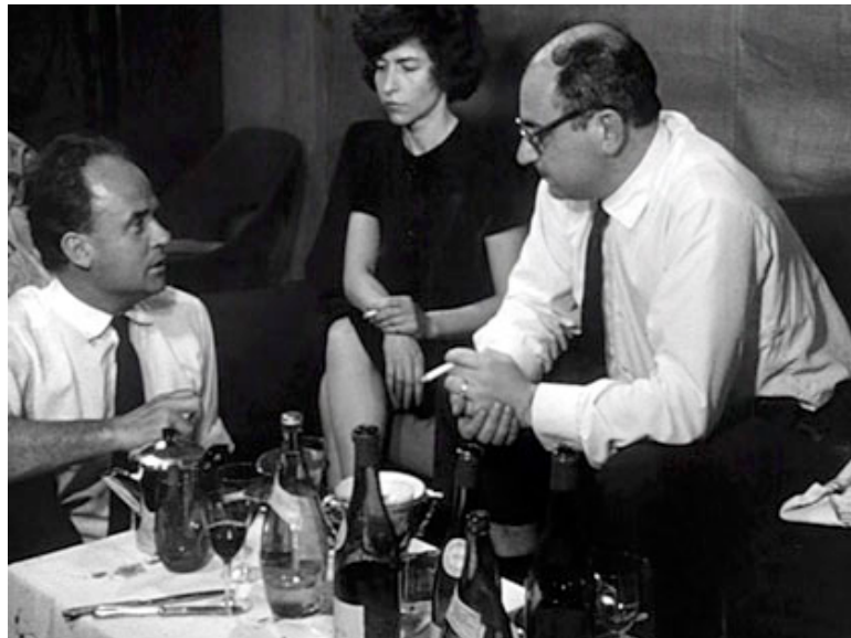
Rouch y Morin reunidos en Chronique d'un été

“etnograficidad” del cine. Su Chronique d'un été (1961), co-dirigida con Edgar Morin, lleva el subtítulo “ Une expérience de cinéma vérité ” aparentemente en homenaje a Vertov. Con la experiencia del rodaje directo con un equipo liviano y portable –innovación tecnológica que, no lo olvidemos, precedió y condicionó la estética de este cine–, Rouch y Morin descubrían el poder que la cámara poseía de provocar en los sujetos un comportamiento diferente o atípico; un poder que, de alguna manera, liberaba al sujeto por un momento de su propia y limitada subjetividad, de su “invisibilidad”, y lo alentaba en un ejercicio de exposición pública. Los dos cineastas se lanzaban a la calle con una cámara RTM Eclair , de apenas 3 kilos de peso, para captar opiniones directas, espontáneas, sobre el momento político, a propósito de la liberación colonial de Argelia.