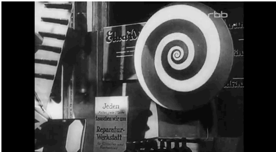
Escaparate en Berlín, sinfonía de una gran ciudad

los destellos de un aura que se ha tornado falsa y obscena con la modernidad. La prostituta devuelve su mirada a quien la mira, y quien la mira ensueña una mirada cargada de deseo correspondido, de aura. Pero esa mirada lo único que desea y reconoce es el dinero, porque toda ella es mercancía. Benjamin, a través de Baudelaire, desnuda la dinámica de un mundo devenido infierno, como el mundo que re-presentaban los alegoristas