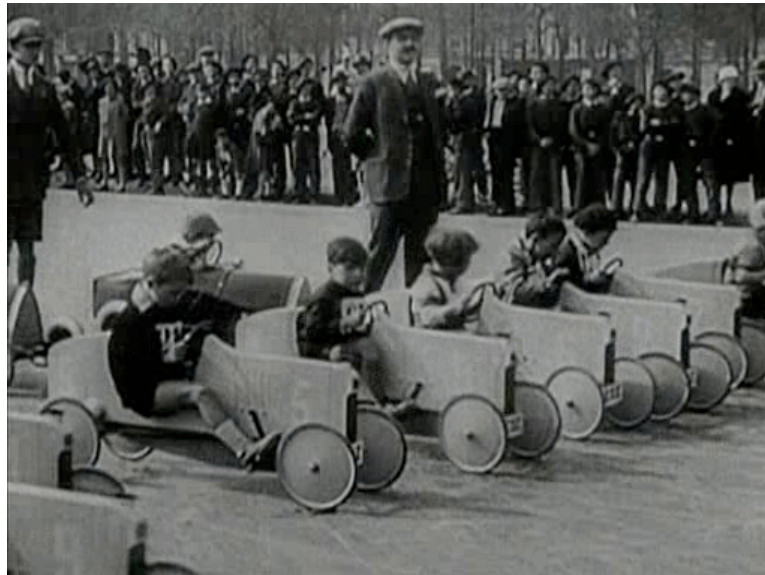
Carrera de cars en Berlín, sinfonía de una gran ciudad

de masas, del circo, de las variedades, de las Tiller girls ; de los bares abarrotados y de los clubs de baile. La ciudad entera parece estremecerse bajo el ritmo frenético de los tacones de los bailarines.