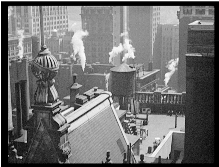
Fotograma de Manhatta

¿Qué dioses pueden superar a estos que me llevan de la mano y que otras voces que quiero me llaman presto y en alto por mi nombre más íntimo cuando me acerco?