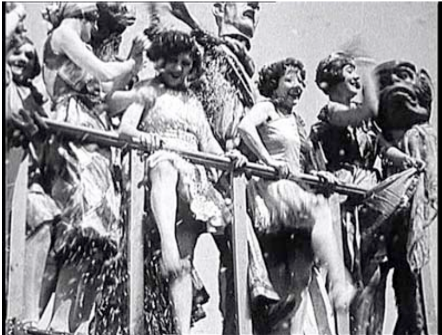
Imagen carnavalesca en À propos de Nice

que el ojo no veía, como las sutilidades de un rostro que expresaban una vida interior. Pero frente a la complejidad de la relación entre objetividad y subjetividad, entre la voluntad del hombre y la máquina, que se observa en Vertov, Vigo se decanta por un cine documental basado en la realidad, pero no exento de un fuerte compromiso: “Este documental exige que se tome postura, porque pone los puntos sobre las íes. Si no implica a un artista, por lo menos implica a un hombre.” (Vigo, 1961).