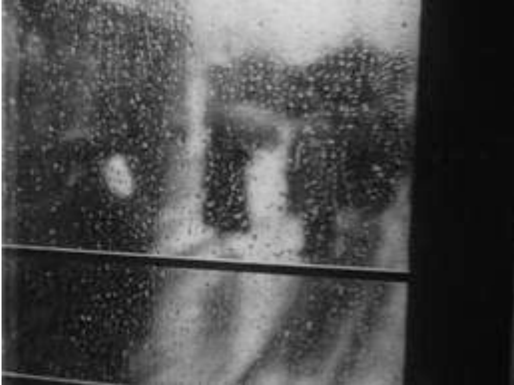
Lluvia sobre cristales en Regen

Y mientras Ivens abordaba lo urbano desde una actitud lírica, Jean Vigo lo hacía desde una actitud crítica y satírica en À propos de Nice . Efectivamente, en 1929 Vigo se entregaba a la realización de un mordaz retrato de la vida burguesa en la ciudad mediterránea, y lo hacía desde la perspectiva de un falso convaleciente en silla de ruedas, el camarógrafo Boris Kaufman – hermano de Dziga Vertov–, que ocultaba la cámara entre las mantas que lo cubrían. La utilización de una cámara oculta es significativa de la concepción del cine documental de Vigo, cercana a los presupuestos del Kino-Pravda de Vertov, que consideraba imprescindible la no intervención del observador en la realidad, es decir, que el objeto de la mirada no notase que estaba siendo filmado. “El personaje deberá ser sorprendido por la cámara, de lo contrario hay que renunciar al valor “documento” de ese tipo de cine” (Vigo, 1961). En su concepción del cine documental se advierte la ascendencia que el cine-ojo de Vertov ejerció sobre Vigo, que él prefería denominar “punto de vista documentado”. Vigo, como Vertov, creía que la cámara podía captar aquello