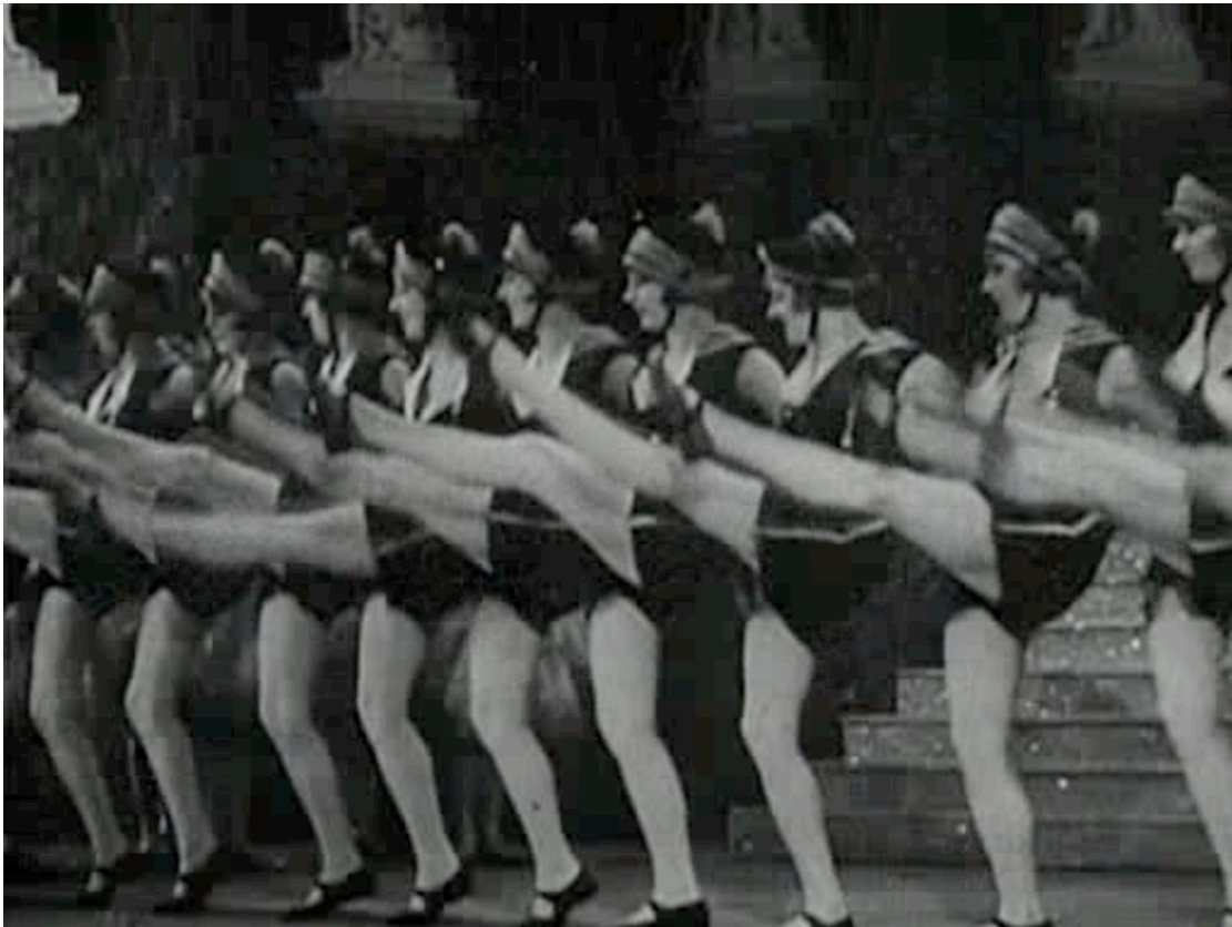
Espectáculo de masas en Berlín, sinfonía de una gran ciudad

su ámbito privilegiado: los medios de comunicación de masas, especialmente el cine. En la modernidad, medios de comunicación de masas y vida han acabado por difuminar sus fronteras, hasta el punto de convertirse en indistinguibles los unos de la otra.