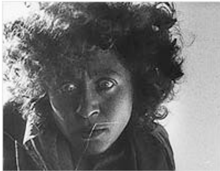
Primer plano en Berlín, sinfonía de un gran ciudad

Para Simmel, no obstante, esta nerviosidad , indolencia y reserva que rigen la gran mayoría de las interrelaciones urbanas tiene potencialmente también un contrapeso positivo, al crear las condiciones necesarias para el desarrollo de la libertad individual. El individuo se ve liberado de la estrechez y cerrazón de comunidades más pequeñas, de las estrictas delimitaciones entre grupos pequeños, para sumergirse en un entramado social mucho más complejo en el que las penetraciones y permeabilidades de los grupos son constantes. En este contexto, la unidad interna inmediata del grupo o círculo se relaja, y la movilidad del individuo se torna más fluida. Tal y como apuntan Remy y Boyé, estas condiciones de vida e interacción social que impone la ciudad ofrecen asimismo “la posibilidad de hacer coexistir dos mundos: uno visible, el otro invisible, que escapa al control de los demás. Esta posibilidad de existencia de un mundo secreto está ligado a la individualización del mundo de la vida urbana” (Remy y Boyé, 1976: 201).