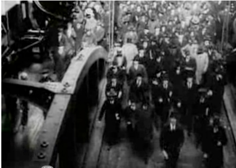
Muchedumbre saliendo del ferry en Manhatta .

sucedan a un ritmo vertiginoso. Y lo mismo se puede decir de El hombre de la cámara , en la que los planos generales aéreos ofrecen a vista de pájaro una panorámica del hormigueante movimiento de la multitud, y la totalidad de la vida se mueve al son de la máquina. Todas las sinfonías registran, de una manera u otra, esa nerviosidad como algo que está ahí y que es inherente a la vida urbana; en Regen , son los paraguas los que garabatean ese movimiento nervioso que recorre las calles sin detenerse ni siquiera ante las inclemencias del tiempo, y en Rien que les heures , aunque pone su foco de atención más en las individualidades que en la multitud, esta condición “nerviosa” de la vida urbana queda enfatizada en secuencias como aquella en cámara rápida en la que la vendedora de periódicos se da a la carrera, y, en montaje paralelo, las portadas de los diferentes periódicos se suceden en acelerados movimientos circulares. Esta “nerviosidad” adquiere un tono marcadamente negativo en Berlín en ciertas escenas clave, como las imágenes de unos ojos desorbitados, la secuencia de la montaña rusa o la de la espiral móvil. Todo parece encaminado a mostrar el riesgo de desequilibrio mental del individuo en la gran ciudad.