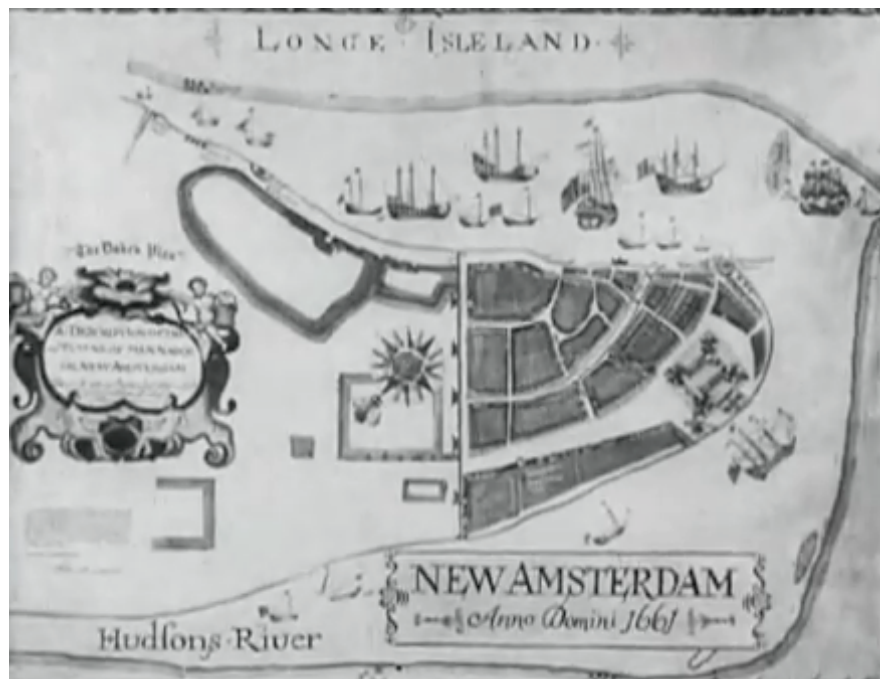
Imagen de The Twenty-Four-Dollar Island