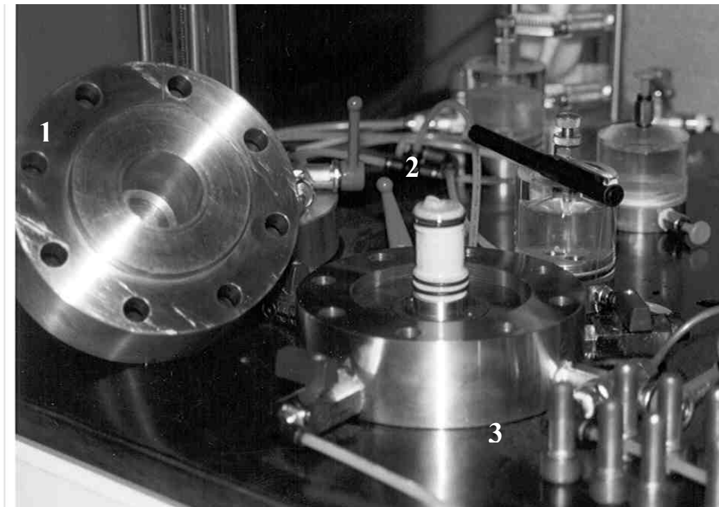
Figura 3.19 1) Cuerpo superior (cámara de confinamiento 29 mm de espesor, 2) Muestra montada en el pedestal, 3) cuerpo inferior de la mini-célula con control de succión.