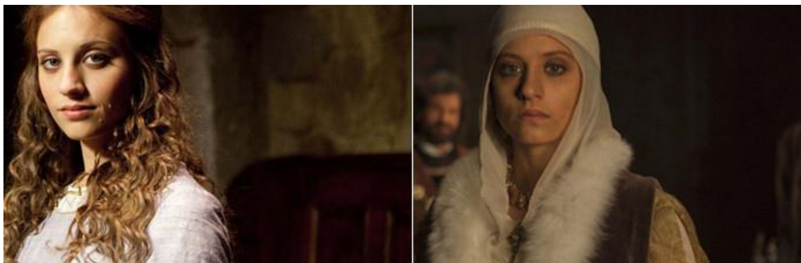
Imagen 10: Contraste del aspecto entre la Isabel joven de la primera temporada (izquierda) y el mismo personaje envejecido (derecha). Fuente: https://www.huffingtonpost.es/2014/10/09/isabel-premio-nacional-television_n_5957078.html [última consulta 14/04/2018]

Como podemos apreciar en la imagen que precede (izquierda) del personaje de Isabel, existen paralelismos entre la imagen de Lolita infantil 61 de la figura de la futura reina con la de la protagonista de LS, ya que se sigue con la caracterización inocente mediante los tirabuzones, el pelo, los ojos claros, la sonrisa dulce y la vestimenta muy clara, en tonos blancos y beige. Esta luminosidad se va oscureciendo en la serie a medida que avanza la trama. De hecho, el relato nos invita a acompañar a la