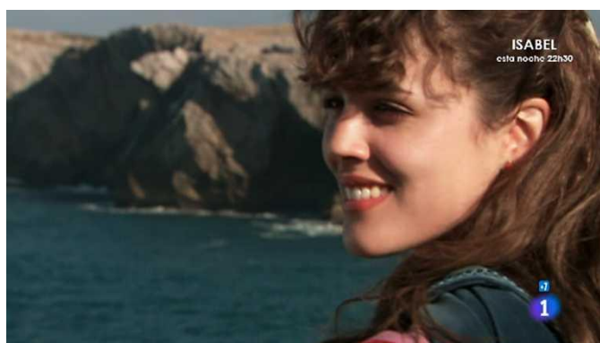
Imagen 5: Fotograma promocional de La Señora (temporada 1). Victoria Márquez adolescente en el acantilado donde conoce a Ángel y donde vuelve siempre a meditar cuando se le presentan dificultades vitales.