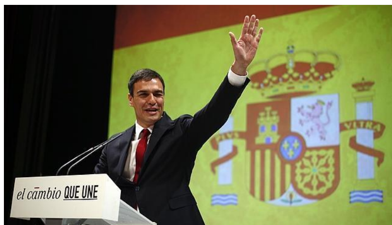
Imagen 4: Foto de Pedro Sánchez, secretario general del PSOE, frente a la bandera constitucional en su acto de presentación como candidato presidencial a las elecciones generales - 21/06/2015.

Antes de cerrar el capítulo que dedicamos a enmarcar históricamente los productos culturales que analizaremos después, es menester para el caso que nos ocupa revisar cómo la ruptura del centralismo geopolítico ha resultado también un «armario» del que todavía le cuesta salir al núcleo duro del PSOE. No es casual (por generar de nuevo un paralelismo con el momento presente) que Pedro Sánchez, actual secretario general del partido, se mostrara en la precampaña de las generales con la bandera monárquica de fondo.