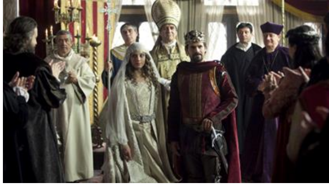
Imagen 11: Infanta Isabel (izquierda) desposa al príncipe Fernando (derecha) (capítulo 9 de la temporada 1).

Como se puede ver, el carácter estricto de Isabel figura como uno de sus principales rasgos, tanto en el ámbito público (en el despliegue de sus habilidades políticas como monarca) como en el privado (en el asunto matrimonial). Nos viene bien recuperar estas líneas porque es en esta temporada en la que más se destacan los rasgos personales de Isabel, los que condicionarán sus decisiones como mujer, reina y madre y, por tanto, sobre los que se asentará el desarrollo de la trama. En el capítulo siete de la primera temporada (1x07), uno de los hombres de la corte de Isabel, Gutierre de Cárdenas, enviado a conocer a su futurible marido, se la describe de la siguiente manera: