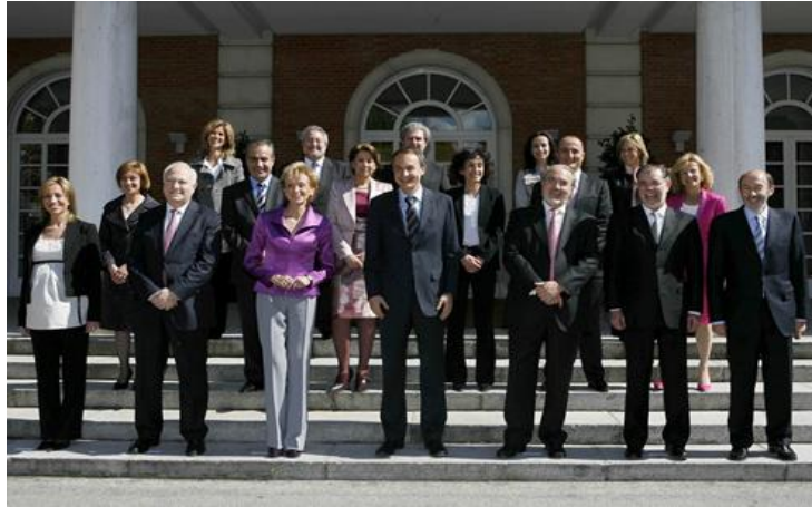
Imagen 2: Foto de familia del Gobierno de José Luis Rodríguez Zapatero, tras las Elecciones Generales de 2008. Palacio de La Moncloa, Madrid - 14/04/2008.