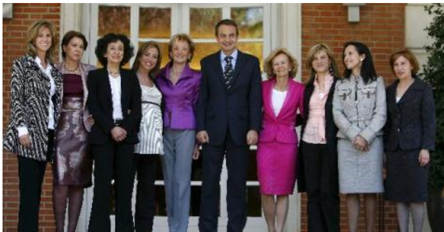
Imagen 3: Primera foto de Zapatero con sus 9 ministras en Moncloa - 14/04/2008.