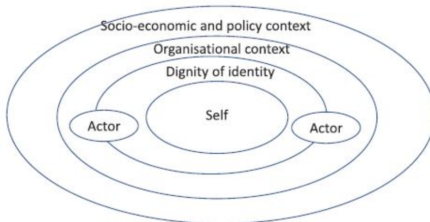
Figura 1. Conceptualización psicosocial multinivel de la dignidad en el empleo turístico (Winchenbach et al., 2019, p. 1035)

Dicho esto, estamos en condiciones de formular las preguntas de investigación: