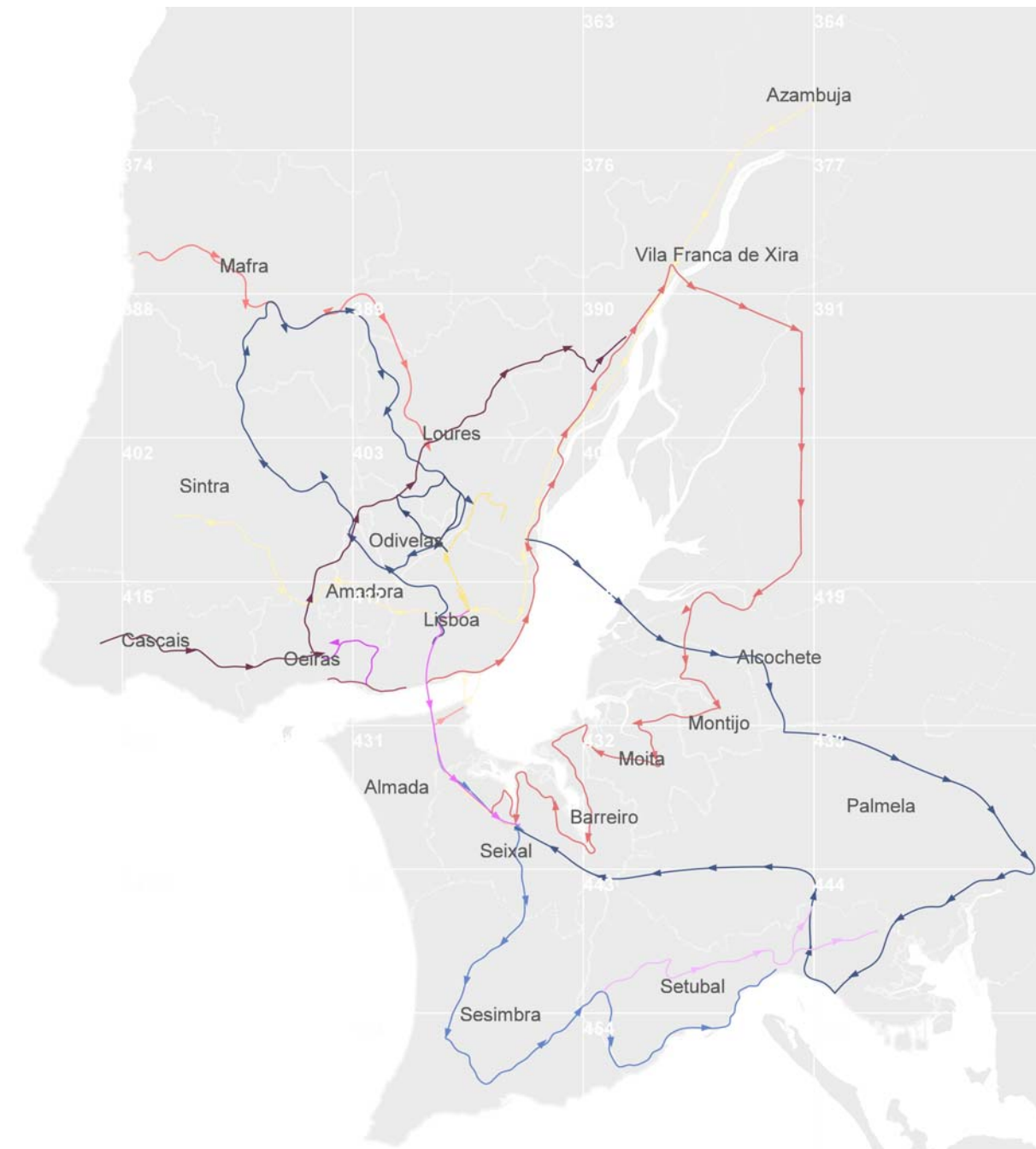
TABLA 2. Trayectos con fotografías presentadas secuencialmente en los varios capítulos.