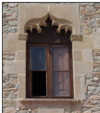
Can Verboom de Premià obra amb pedra de Montjuic de Barcelona

Molts dels elements arquitectònics que s'utilitzaven a les obres són materials que ja es compraven prefabricats als picapedrers de les pedreres. És en l'escultura decorativa, més freqüent en les finestres de masies, on aquests elements es veuen de forma