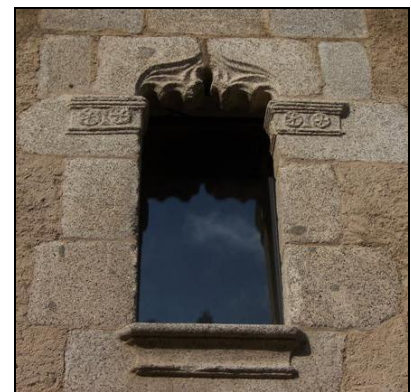
Can Badia (Argentona) obra amb pedra granítica local