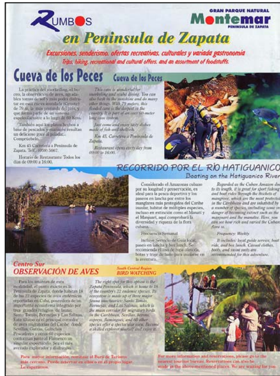
Figura 2.3: Activitats que ofereix Rumbos al Parc Natural Montemar (Cuba)