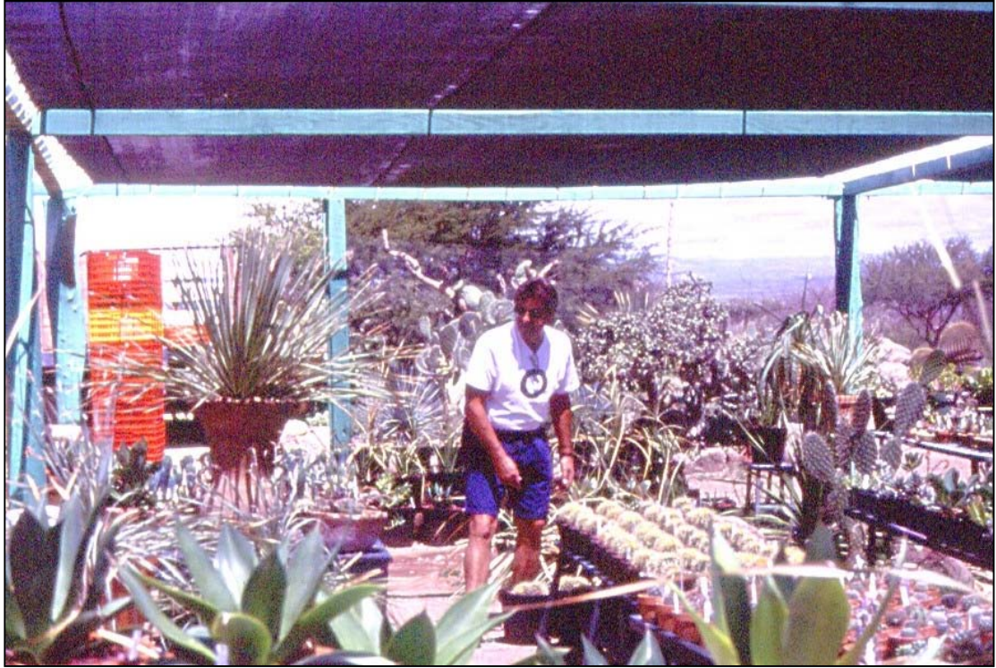
Fotografia 2.1: Jardí botànic de cactàcies, CANTE, Mèxic