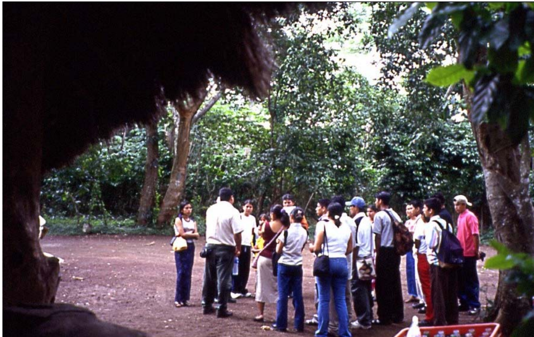
Fotografia 2.2: Guia de la Fundación Cocibolca donant recomanacions als turistes abans de visitar el Parc Nacional Mombacho, Nicaragua