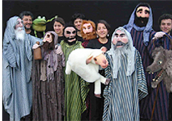
Companyia Valivan representant la paràbola de L'ovella perduda.

Jesús sinó que són un espectacle de tres peces basades en les paràboles de Jesús: "El fill pròdig", "El bon samarità" i "L'ovella perduda". Van començar la fira el mes de febrer de 2004 a diferents escoles del País Basc.