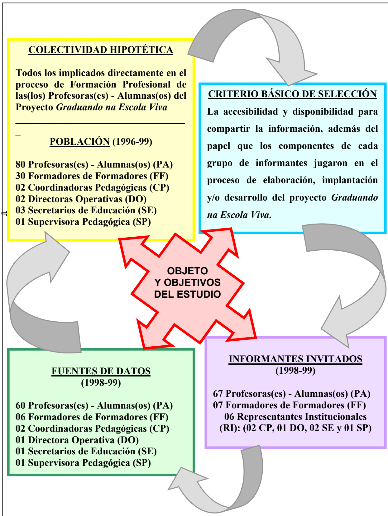
Figura 3.2. Ciclo de muestreo de la investigación.